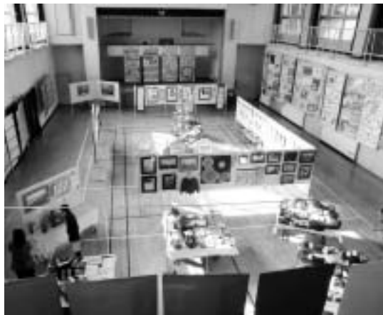
来年もたくさんの出品をお待ちしています。