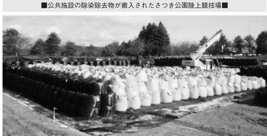
■公共施設の除染除去物が搬入されたさつき公園陸上競技場■