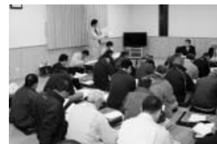
■仮置場の地区検討会（11月7日） “村内6地区で開催されました”