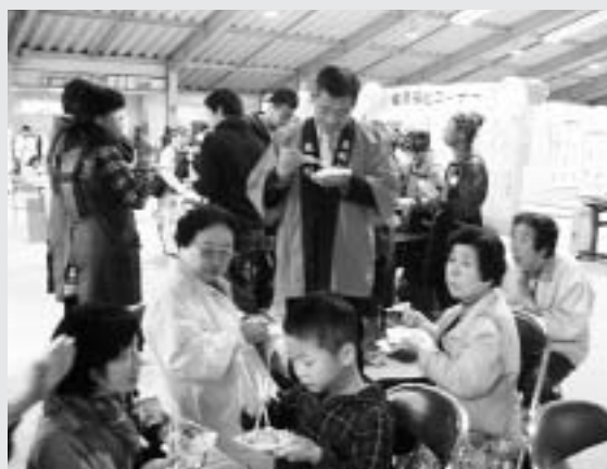
村民文化祭（試食コーナー）