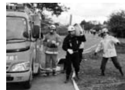
■消防団早朝防衛訓練（11月10日） “火災シーズンに備え原地区で実施”