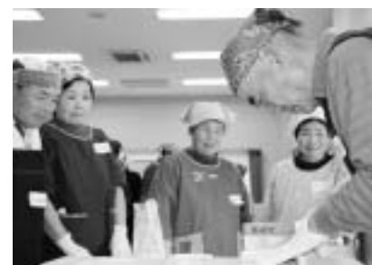
■e-村民蕎麦打ち交流（11月10日） “皆さん真剣そのものです!”