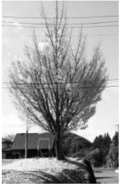
11月下旬、落葉をはじめた谷地久保地内のイチョウの木

活が大切です。痩せ過ぎや肥満、塩分の摂り過ぎは、100〜200ミリシーベルトの放射線を受けた場合より、がんになるリスクを高くするといふ研究報告があります。また、カリウムは、ナトリウムの排泄を促し、血圧の上昇を抑えるなど、健康を保つのに必須の栄養素です。カリウム40は、カリウムに一定比率（0・012%）含まれているため、カリウム40だけ避けることはできません。ごく少量の放射性物質の健康への影響については諸説ありますが、野菜や果物などからカリウムを摂り、食品をバランスよく食べることが大切です。