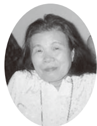
泉崎村友の会理事 神奈川県横浜市在住（北平山出身）