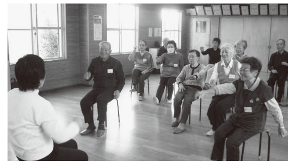
八雲地区・歌体操 皆さんの笑顔が素敵ですね