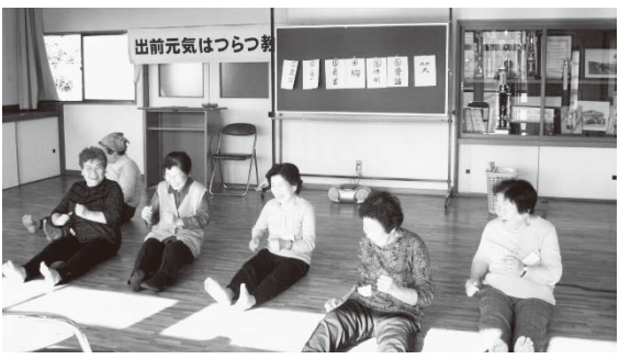
峠地区・健康体操 家でも気軽にできる体操です