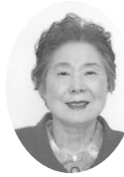
泉崎村友の会庶務会計 神奈川県戸塚区在住(北平山出身)