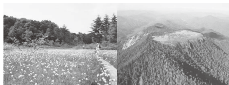
ワタスゲで白い絨毯を敷き詰めたような駒止湿原(6月中旬)