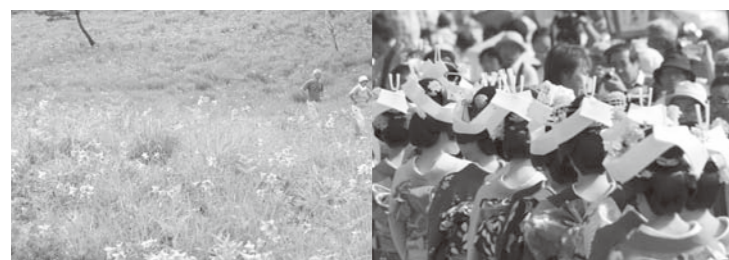
7haの鉢状の草原が淡い桃色に染まる高清水自然公園(6月下旬)