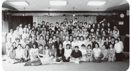
参加者全員による記念撮影