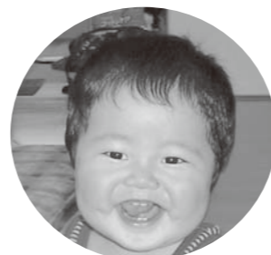
るい 琉生ちゃん 緑河