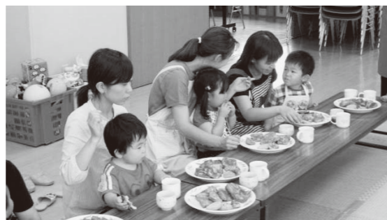
お問い合わせ先 保健福祉課 ☎ 54-1333

応募締切は9月8日(火)です。詳しくは、各世帯に配布しましたチラシをご覧ください。