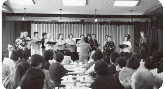
「コールいずみ」の皆さんによる合唱

南会津町南郷総合センターにおいて、「第十二回南会津町合唱交流会」が行われました。泉崎村からは、「コールいずみ」の皆さん十七名が参加され、総勢8団体百二十名の参加者のもと、全体合唱や歌の発表などが行われ、終始和やかな雰囲気の中で、楽しい時を過ごしました。 この交流会は、毎年この時期に「音楽を通して親睦を深める目的」で会場を持ち回りで行っており、今回の会場となった南郷の「コーラスロング」さんや、会員の方々のご厚意で今回「コールいずみ」の参加が実現したものです。散会後には、ちょうど見頃となった美しい「ひめさゆり」群生地を散策し、清々しい時を満喫しました。 南会津町の皆さん交流を通して楽しい時間が過ごすことができました。心より感謝いたします。