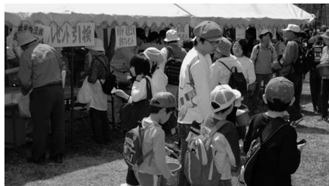
ゴール後には、とん汁の無料サービスやプレゼント抽選会が行われました。