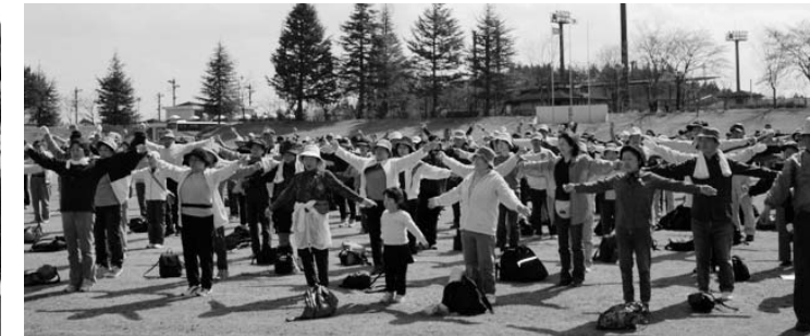
みんなで楽しくウォーキング！！