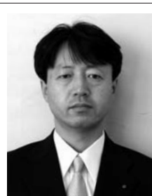
※4月より県に復帰され、企画調整部計画評価グループ主幹として勤務。

最後に、私は、住民の皆様笑顔と元気が役場の元気に、さらにそれが村自体の元気に、そしてそれが再び皆様のますますの笑顔と元気につながってくるものと考えております。そのような村づくりのため、どうか皆様のかたんのないご意見としてご指導を賜りますようお願い申し上げます。就任の挨拶とさせていただきます。