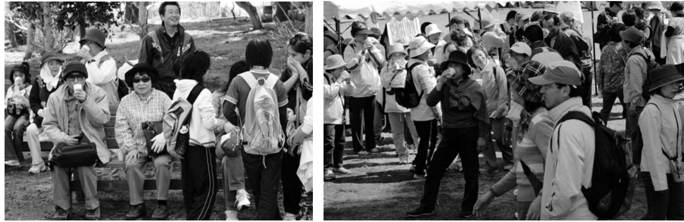
昌建寺では、参加者に甘酒が振るまわれました。