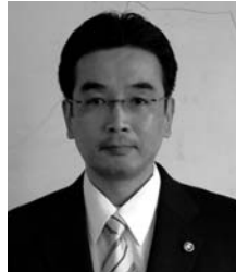
※昭和38年会津美里町(旧会津高田町)で生まれ、4月から泉崎村副村長として県より派遣。