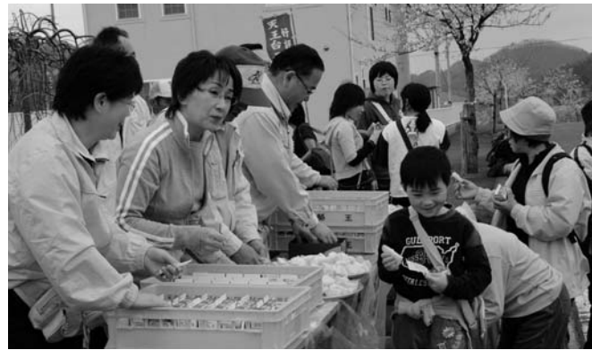
天王台では牛乳とパンがサービスされました。