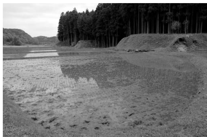
作業開始から1時間程度で見事に植え終わりました。