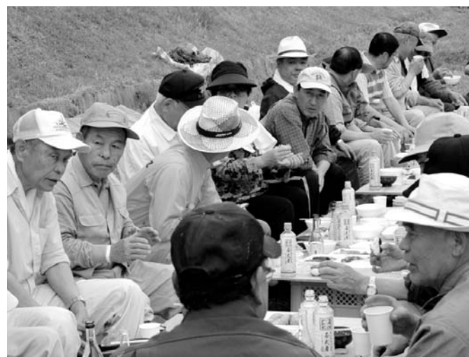
作業終了後の地元料理はとても美味しかったです。