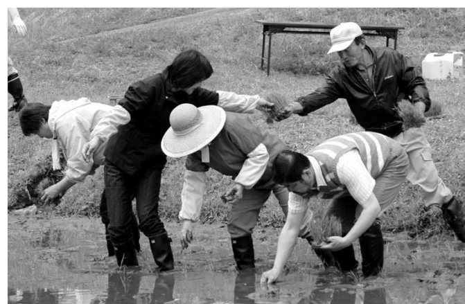
苗を貰うのも足元が不安定でひと苦労...