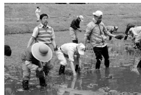
愛情を込めて一本一本丁寧に植えていきます。