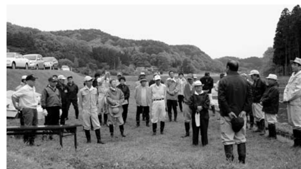
晴天の下、開会式が行われる。