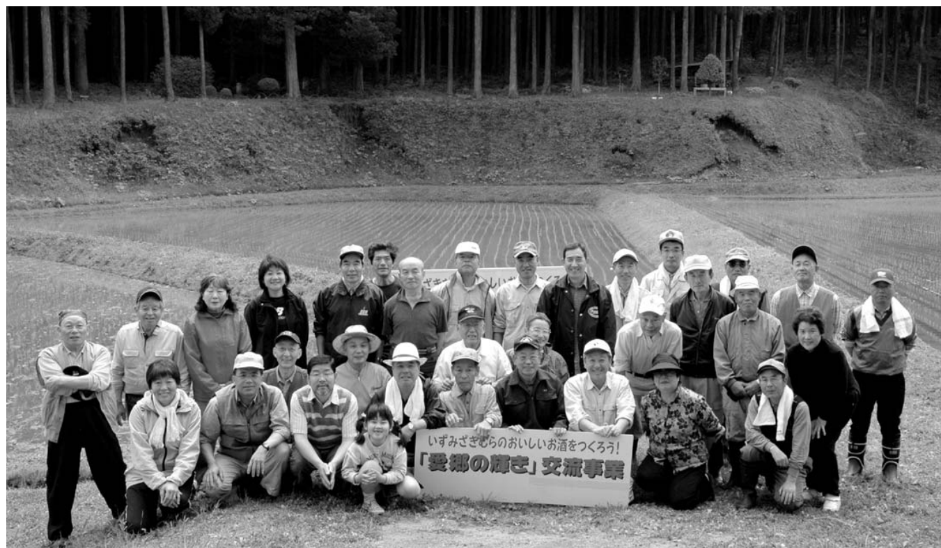
豊作を願い参加者全員で記念撮影。