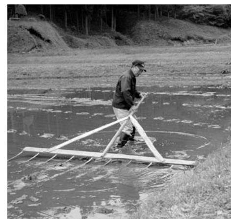
「かじ棒」を使って田んぼに線を引いています。