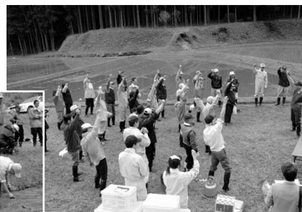
大木代吉酒造の社長の「エイ・エイ・オー!」のかけ声でいざ田んぼへ!!