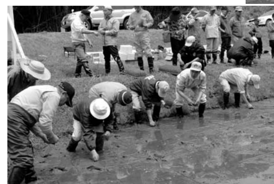
苗を植え始める前に講師の方から指導を受ける参加者のみなさん。