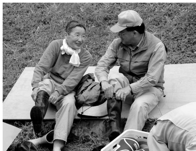
長靴に履き替え田植え作業の準備は万全!