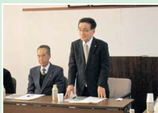
28日 西白河地方町村議会 議員研修会