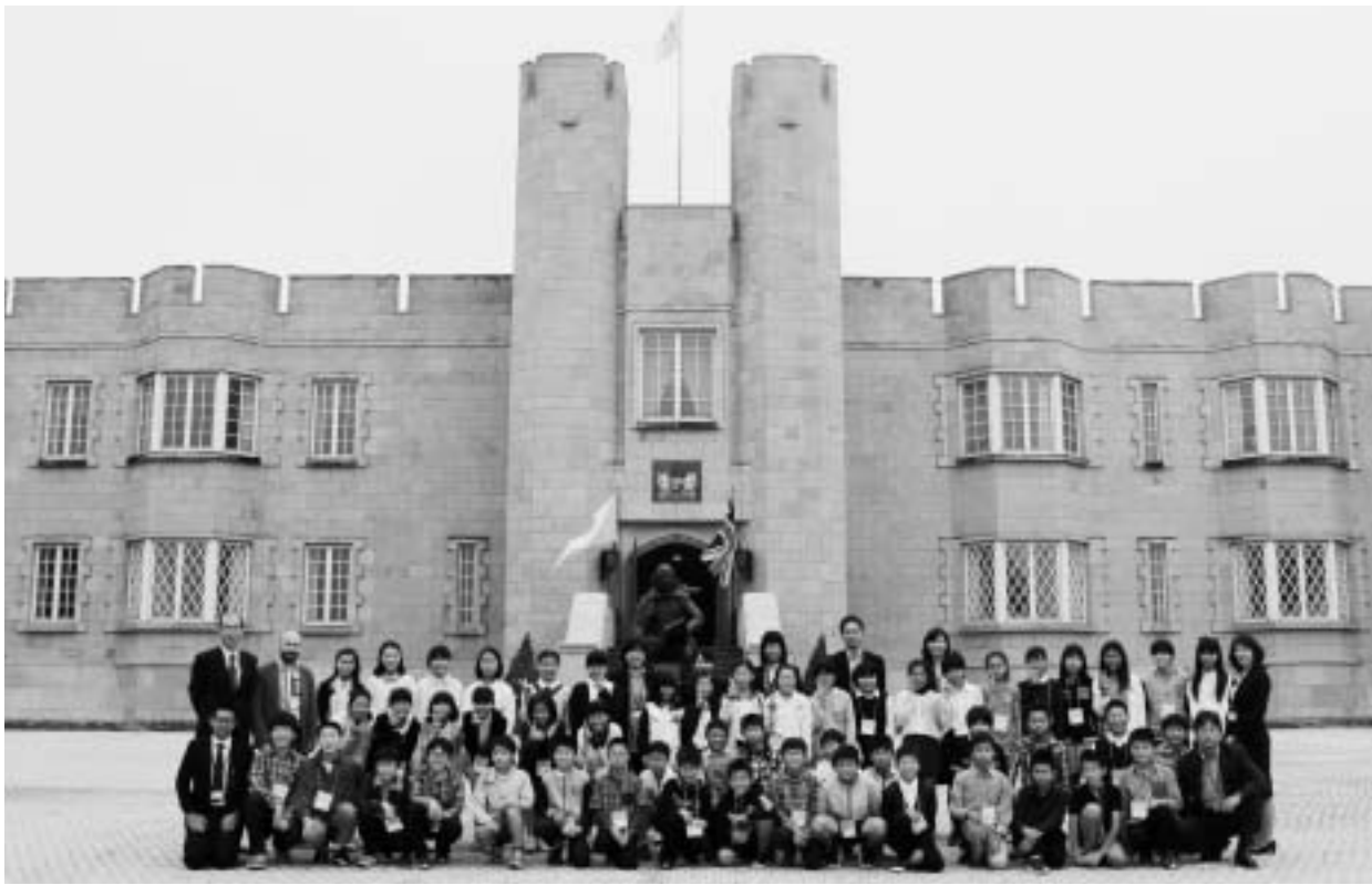
第一小学校と第二小学校の仲間で合同の異文化体験宿泊研修