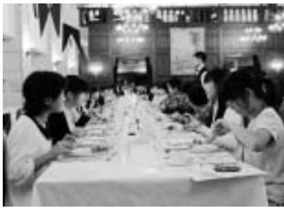
英国式テーブルマナーによるフルコースディナー