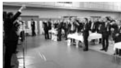
落成記念祝賀会での乾杯