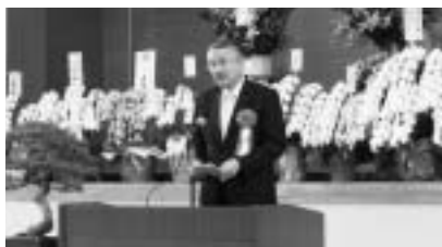
鈴木正晃副知事の祝辞