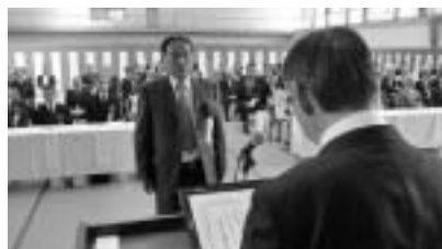
地権者への感謝状贈呈