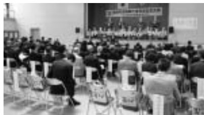
落成記念式典の様子