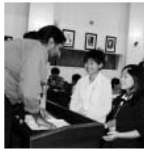
May I checkin please.