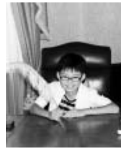
英国王室の執務室