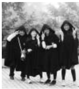
中世英国貴族のマント