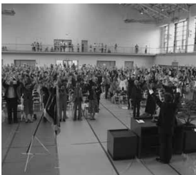
・その他の質問事項 区長・組合長会議について

分出している。ですから、計4600円分は出している。これは、よその市町村の5千円に匹敵するお祝い金なり記念品を出しています。ですから、それを今後どうするかの問題なんです。それを一挙に1万円にしようことなのか。ただ、全体の基金、積立金ですね、いろいろあります。減債基金から財政調整基金からいろいろございます。私は20億円ぐらいは基金として積みたいと思っております。よそがやらない段階で1万円お祝いとして出しようという体質になっていくかという、まだそこまでいいない。