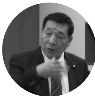
鈴木 清美 議員

受け補助がされます。鈴木 組織がある場合はいいが、無い場合、村として単独に自分の田畑を守るためにどんな対策をとっているのか。