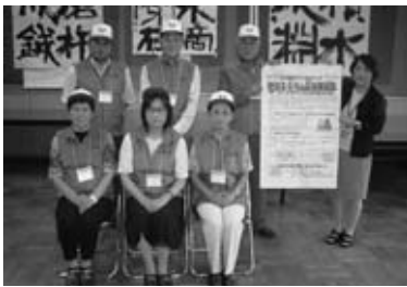
泉崎第二小学校区地域スクラム応援隊