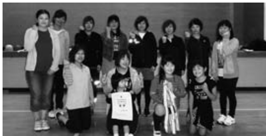
女子優勝 踏瀬支部