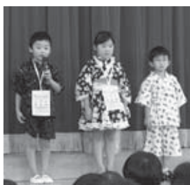
「はじめのことば」を話す代表児