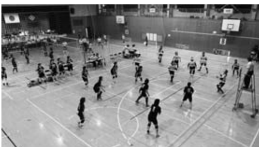
家庭バレーボール

結果は次のとおりです。 バドミントン 第3位 バレーボール 第3位 卓球 予選敗退