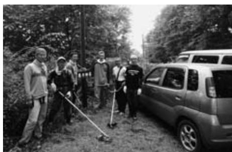
草刈りをするマウンテンバイク愛好会

8月20日(日)には鳥峠でマウンテンバイクを楽しんでいる6名の皆さんが草刈り作業をするなど、鳥峠への関心、愛着が高まってきています。