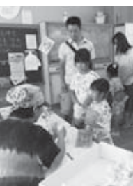
「ポップコーン、 「なっとう音頭」を元気に踊る子ども達 いい匂い」