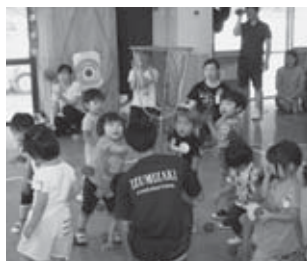
それ、入るといいな

9月8日（金）保育所ホールにおいて、2歳児による親子運動会が行われました。 宝拾い、玉入れ、リズム等の競技に元気良く参加しました。