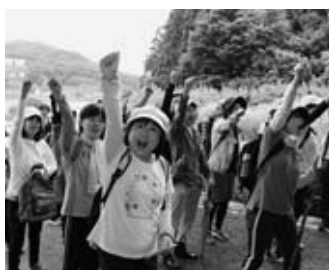
山頂を目指す教職員

山頂では、社務所を借りて昼食をとり、その後、なかなか目にするのではない蝶「あさぎまだら」や「山野草」の講話・楽しいクイズなどで有意義な時間を過すと共に、教職員同士の親睦を図りました。