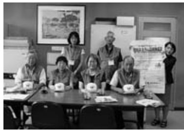
泉崎第一小学校区地域スクラム応援隊

地域スクラム応援隊の隊員を随時募集しています。ご協力いただける方は担当までご連絡ください。保険加入のため、年齢、生年月日、住所をお聞きします。また、見守り場所を確認します。 ☎0248541533 ◎村教育課学校教育グループ