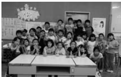
クッキーづくりを楽しんだ子ども達

参加した児童25名は、「作る楽しさ」「見る楽しさ」を味わい、さらに「今回チャレンジした自分へのプレゼント」だとラッピングをしては笑顔を見せ大満足でした。