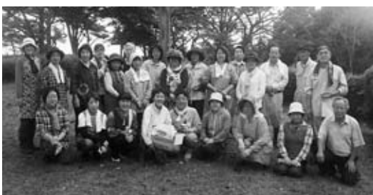
清掃作業に参加された皆さん