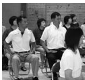
姿勢を正して講演を聴く教職員

事を成しとげやすい」「印象がアップする」等のメリットが多くあることから、今後も継続して「正しい姿勢」を意識しながら生活することが大事であることを確認しました。