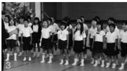
1：久保木村長による万歳三唱。 2：なすびさんのエベレスト登頂記。3：第二小学校2・3年生。4：中学校器楽部。5：しあわせ金婚夫婦表彰。6：泉崎さつきレクダンス。7：太田川梅和讃唄念佛踊保存会。8：サークルハイビスカス。9：泉崎村峠節保存会。