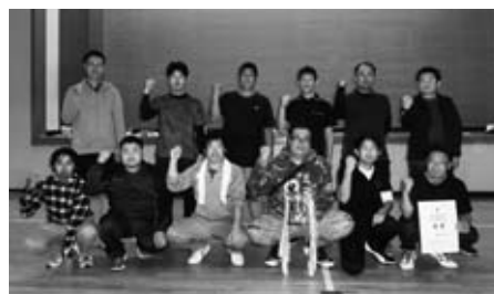
男子優勝 北平山支部