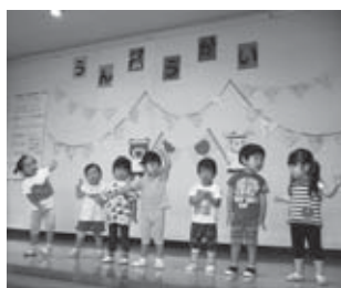
準備運動をします。