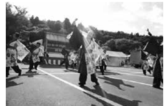
～職員よさこい披露～ 暑さに負けず頑張りました！