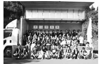
～集合写真～ 熱い1日がこれから始まります！