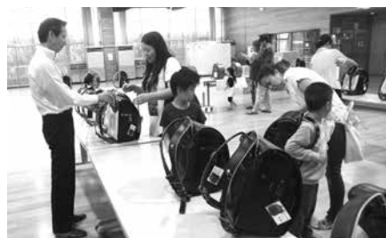
これカッコいいね！

色やデザイン、フィット感を慎重に確かめていました。 注文を受けたランドセルは、来年の1月頃までには泉崎村からお祝いとして、各家庭に贈呈される予定です。