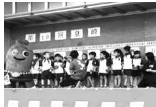
～泉崎幼稚園の皆さん～ 一生懸命、将来の夢をお話してくれましたよ！