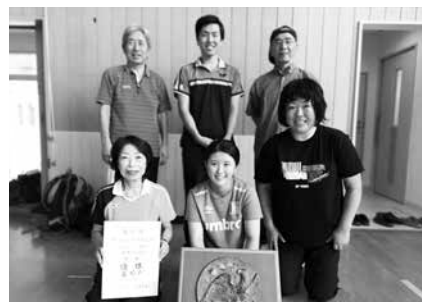
卓球で優勝した泉崎チーム