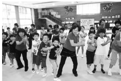
最高の笑顔！ノリノリで踊る参加者