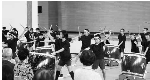
泉崎第一小学校和太鼓クラブ