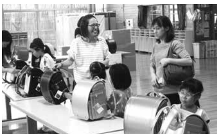
何色がいいかなー？

展示会当日の幼稚園ホールには、榮伸福島工場(泉崎村)で製造されたカラフルなランドセルが展示され、家族とともに会場を訪れた子ども達は、満面の笑みを浮かべながら、ランドセルを背負い、