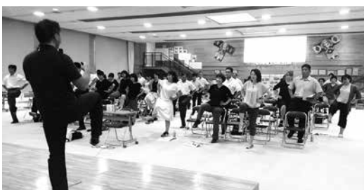
参加者全員で肥満防止運動

最後に「あなたが変わると周りの人も変わっていく!」福島県を健康長寿の県に!あなたの力を貸してください!!」と締めてください、変わるきっかけと運動の継続が大事であることを確認しました。