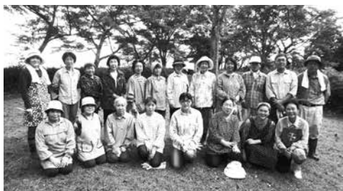
清掃に参加された皆さん