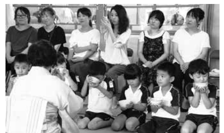
お茶おいしいねー！

茶室に入る子ども達や保護者の皆さんの表情には、程よい緊張感がうかがわれましたが、先生方の温かい言葉で一つひとつご指導をいただきながら作法を学び、貴重な体験ができました。 また、年少児と年中児は、各クラスにおいて和菓子と抹茶をいただきました。