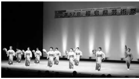
村歌「わが泉崎」を踊る峠節保存会

息の合った踊りを披露すると、客席からは「よいしょ」の合いの手はもちろん、大きな拍手が起るなど会場を魅了し、来場者に泉崎村の魅力を伝えることができました。