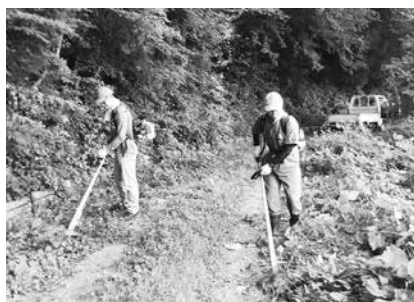
草刈作業を行うマウンテンバイク愛好者

8月18日(土)には、昨年実施されたマウンテンバイク愛好者による草刈作業が行われるなど、鳥峠への関心、愛着が高まってきています。