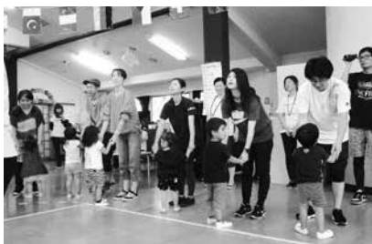
親子で楽しくリズム