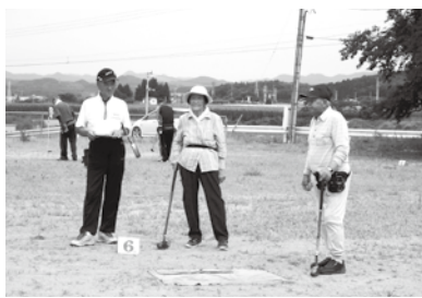
プレーを楽しむ参加者の皆さん