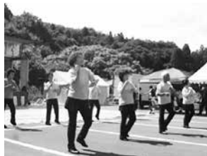
～泉崎さつきレクダンスクラブの皆さん～ 楽しい踊りを披露してくださいました。