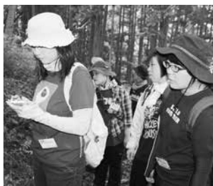
熱心に説明を聞き入る教職員

山頂では昼食をとり、中目宮司の講話、会員によるクイズやハーモニカ演奏の鑑賞など有意義な時間を過ごし、教職員同士の親睦も図りました。