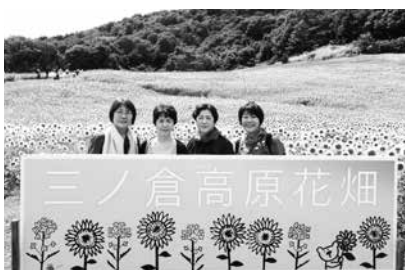
鮮やかに咲き誇るひまわりを觀賞