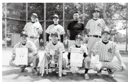
優勝した泉崎タイガース