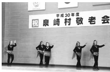
宿館老人クラブの皆さん(老人会にて)