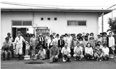
民生児童委員と日本赤十字奉仕団の皆さん

8月12日(日)泉崎村民生児童委員協議会は、泉崎村日本赤十字奉仕団の協力のもと、お盆を前に泉崎村の玄関口である泉崎駅構内外の除草作業を午前6時から行いました。