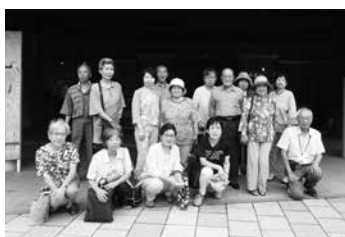
「まほろん」で有意義な時間を過ごしました

学級生は縄文時代の謎の道具「石棒」を見学し、縄文人に思いを馳せるとともに、職員の説明に熱心に耳を傾け、より歴史への理解を深めることができました。