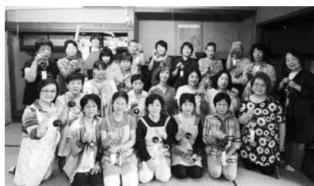
素敵なガラス風鈴を完成させました

今年度の大人の趣味くらぶは「癒し」をテーマに、豊かな心を育む様々な体験をしていく予定です。