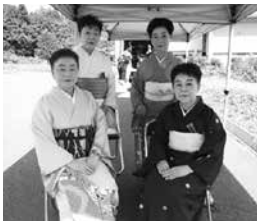
～芳泉流の皆さん～ 素敵な踊りをありがとうございました。

また、来年に向けて、さらに楽しく盛り上がるようなイベント等準備していきたいと思っておりますので、来年もよろしくお願致します。