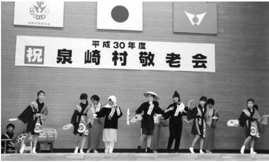
太田川梅若和讃唄念佛踊保存会