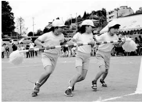
巻き起こせ! 泉二小タイフーン(3.4年)