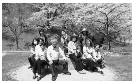
満開の桜の下で記念撮影

春の香りが漂う中、お弁当を食べるなどとして会員同士の親睦を深めることが出来ました。