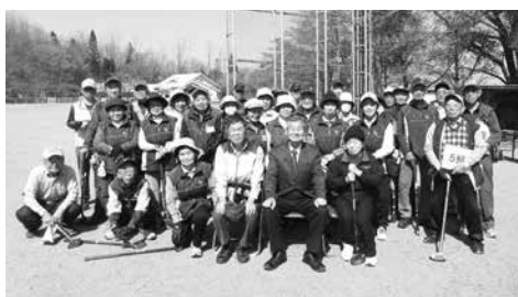
参加者と久保木村長の記念撮影