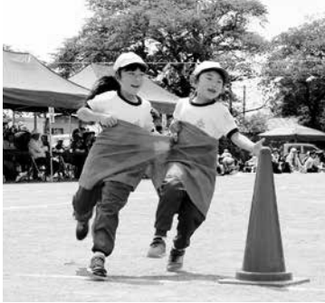
GO! GO! デカパン (1.2年)