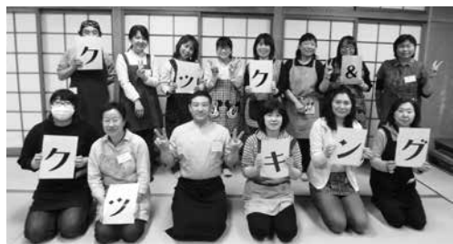
受講生のみなさん

当教室は5月から12月まで毎月第1火曜日に開催され、身近な食材を使いながらも目新しく工夫のある料理や家庭でも手軽に作れるデザートレシピ等を楽しみ、美味しく学んでいきます。