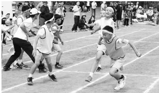
上学年選抜紅白対抗リレー