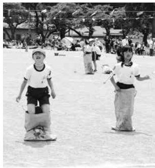
大好き! 泉崎! (3.4年)