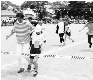
6年生と保護者による強いきずなで!!