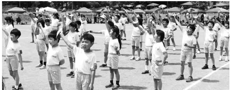
紅白対抗応援合戦