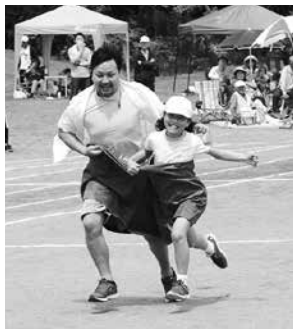
親子で仲良くデカパン・ボン(4年)