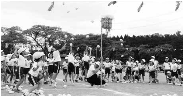
みんなで玉入れ (1~3年)