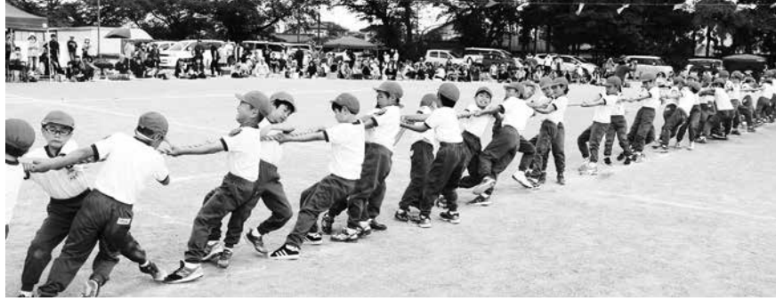
全校生による綱引き