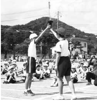
聖火リレーの様子