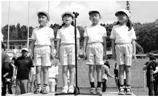
代表児童による開会の言葉