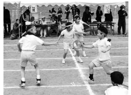
下学年選抜紅白対抗リレー