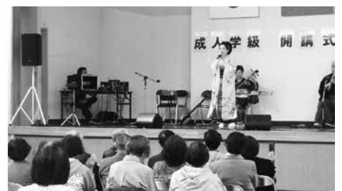
小湊会による民謡公演

主な活動は受講生各自が盆栽を持ち寄り、剪定や整姿について学び、成果を秋の文化祭で出品することとなっています。また、今年度は、6月に研修の一環として、鹿沼市で開催されるさつき展