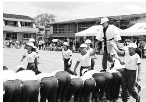
つなげ!! 友情の橋 (5.6年)