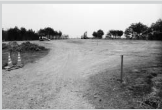
造成工事が着々とすすむ「中核工業団地内」の仮置き場

今年度は、泉崎地区(峠の一部、原方部)、北平山地区(八雲神社含む)、関和久地区を対象として約1500戸の住宅の除染作業を行っていく予定です。各地区において仮置場に適切な場所の情報等がありましたら除染対