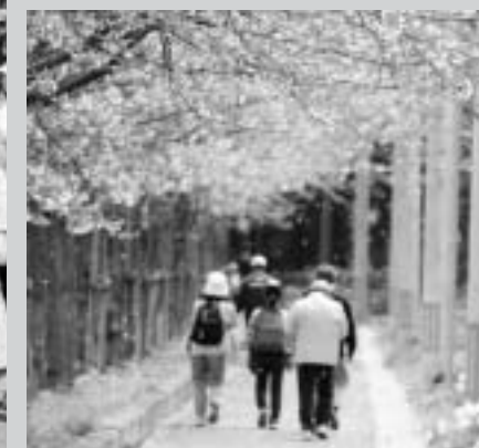
■時折桜吹雪が舞いました。

いずみざき桜ウォーク実行委員会による「第10回いずみざき桜ウォーク」は、4月20日(土)に開催され、参加した約400名は、沿道に咲く桜を楽しみながら約8キロのコースを歩きました。 開催前に暖かな日が続いたこともあり、桜の花は散り際ではありませんが、絶好のウォーキング日和に恵まれ、参加者同士で会話を楽しみながら元気よく前へと進んでいました。沿道に咲く菜の花やスイセンも参加者の目を楽しませていました。