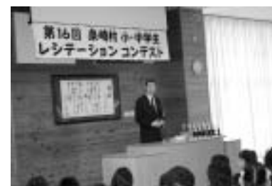
“模範スピーチ”の様子