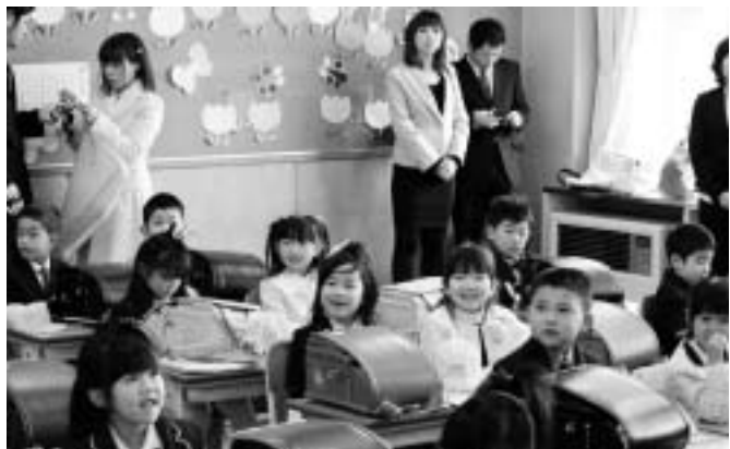
泉崎二小 [男子(10名) 女子(15名) 計25名]