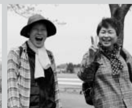
■お二人とも「笑顔」満開