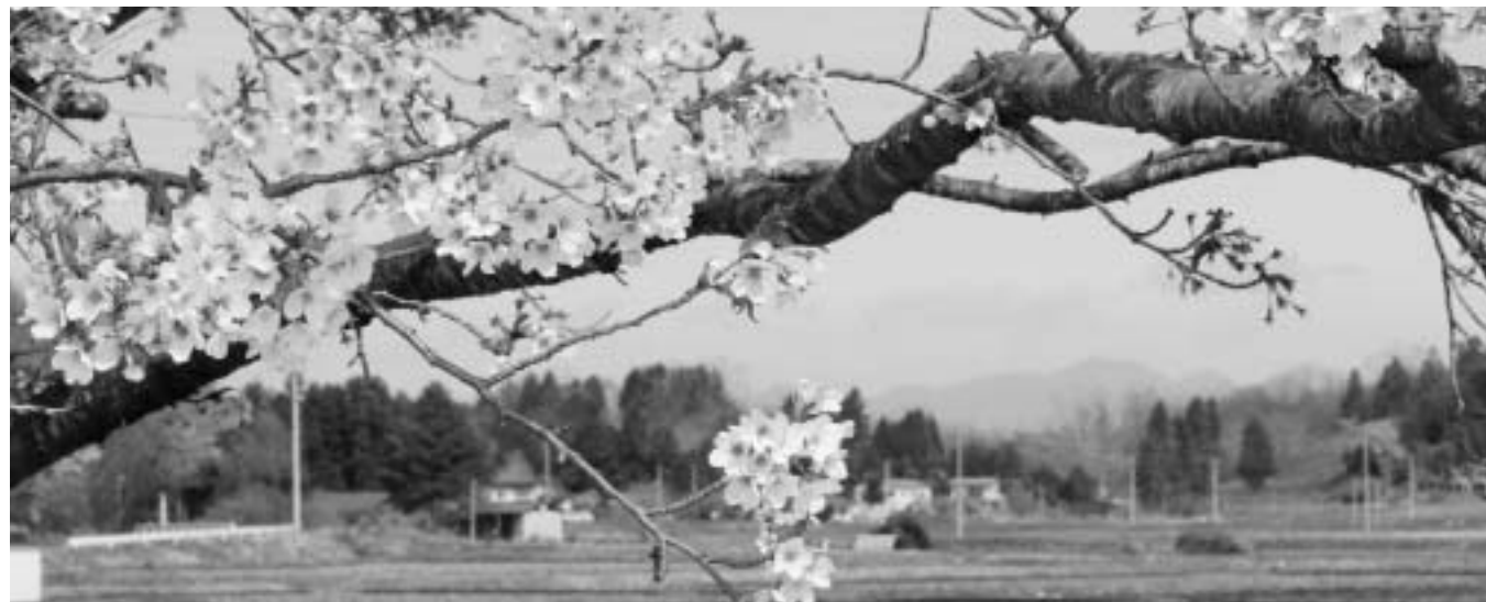
[さつき公園より鶴番小屋方面を撮影 (4/20)]