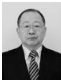
電話相談も受け付けています。

【行政相談委員】皆さんの身近な窓口として相談を受ける民間のボランティアです。行政相談委員法（昭和41年法律第99号）に基づき、地域で社会的信望があり、かつ行政運営の改善について理解が深い方を村長の意見を聴いた上で、総務大臣が委嘱します。