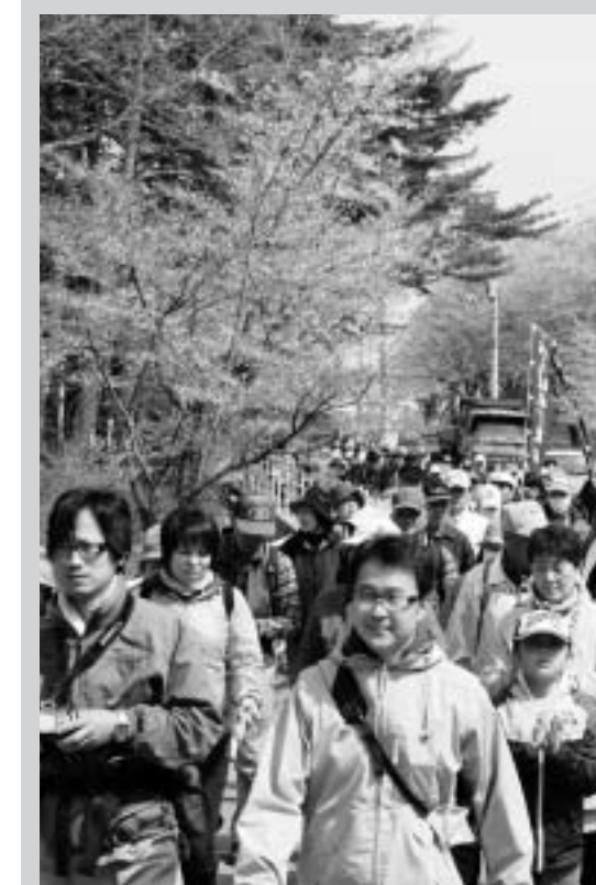
■400人がさつき公園を一斉にスタート