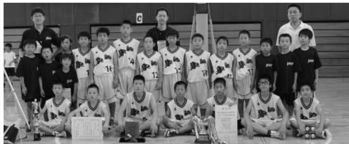
16チームが出場しトーナメント方式で熱戦が繰り広げられました。