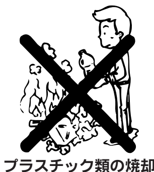
プラスチック類の焼却

野外焼却（野焼き）は、同法の定めにより直接罰の対象となり、5年以下の懲役、若しくは1千万円以下の罰金に処せられるか、これを併科することとなります。