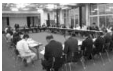
連絡員会議の様相。会議終了後、懇親会も行われました。