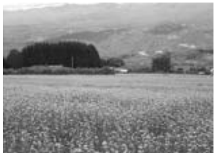
広大なそば畑です。