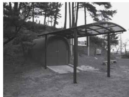
泉崎横穴修復後外観

今回の修復事業では、最新テクノロジーを駆使した壁画の一部画像復元が行われましたが、その過程で壁画のこれまでの解釈論について学問上新たな課題が発見されました。