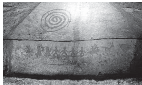
泉崎横穴奥壁復元画像

そこで、壁画の謎解を広く一般の皆様にも参加いただき一緒に泉崎横穴壁画のストーリーを考えてもらおうとコンテストを開催したいと思います。壁画ストーリーコンテストは長編・短編、詩などの部門による応募方式により行われ、優秀な作品は表彰されるほか紙上や資料館企画展での展示紹介、学芸員の案内による本物の装飾壁画特別ツアーなど特賞を用意いたします。