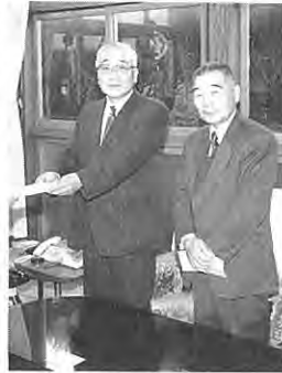
◇ラフォーレ白河 みなさんより

毎年、年末にチャリティーコンサートを開催し、その収益の一部をご寄附いただいています。