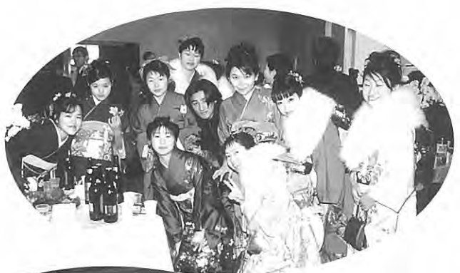
会場は はたちの熱気で あふれました