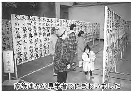
家族連れの見学者でにぎわいました

この展示会は、第二十四回目となり新しい年のスタートを象徴する行事となっています。