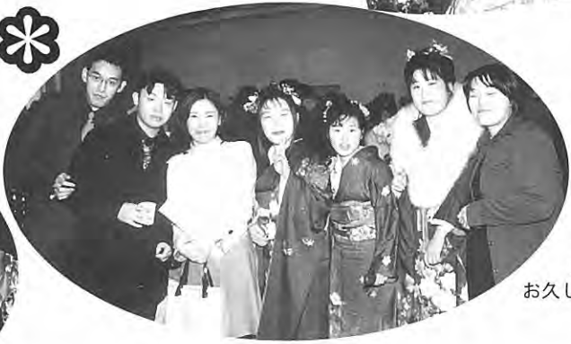
先生! お久しぶりです!!