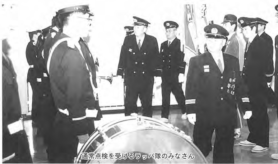
通常点検を受けるラッパ隊のみなさん