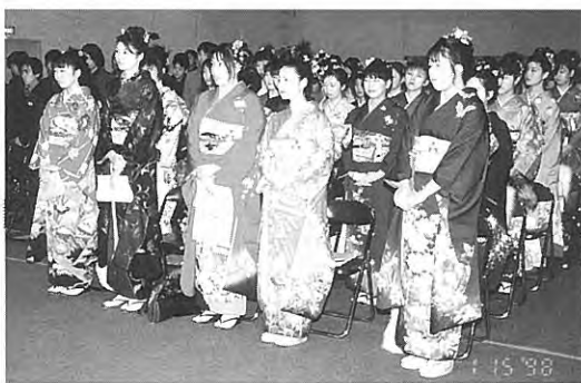
ステキな振袖姿でした