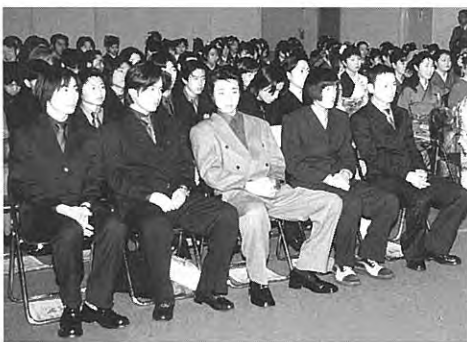
スーツ姿もなかなかでした