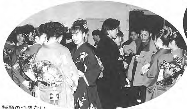
話題のつきない パーティーでした