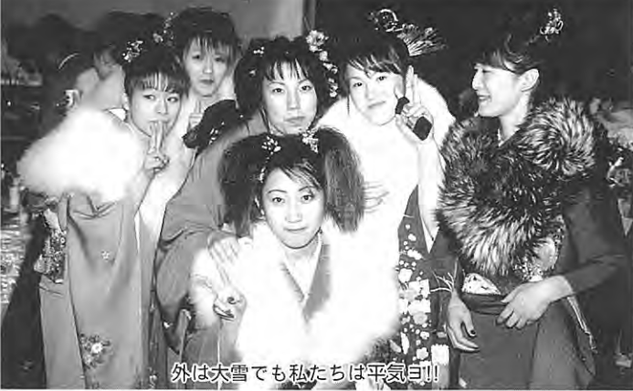
外は大雪でも私たちは平気白!!