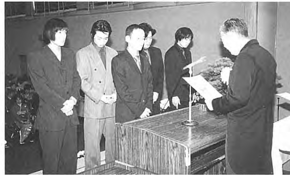
一人ひとりに成人証書が授与されました

式のあと、記念撮影と祝賀会が行なわれ、恩師を囲んで、また、久しぶりに会う友人たちと新たなスタートの時を祝いました。