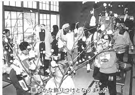
華やかな飾りつけとなりました