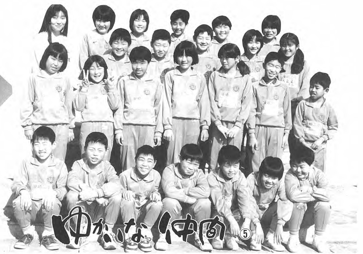
泉崎第二小学校5年2組