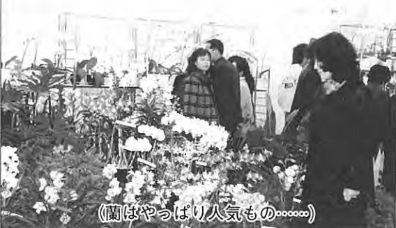
(蘭はやっぱり人気もの...)

しい花園をつくりあげていました。折からの洋蘭ブームもあってか、連日大にぎわいで、愛好家グループや家族連れのみなさんは、当バイオセンターで丹精こめてみごとに咲かせたあでやかな花々に見入っていました。また、バイオセンター職員がやさしい手入の方法、越冬の方法など一人ひとりのみなさんに真心をこめて説明するのに対して、入場