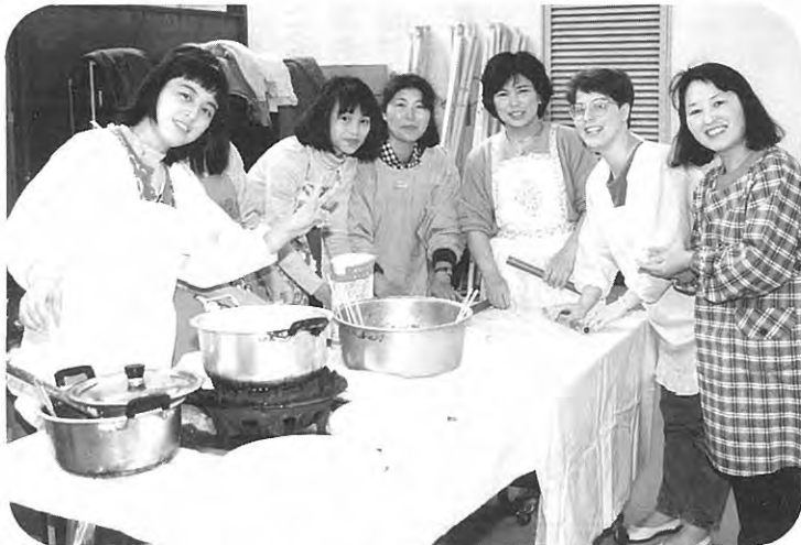
日・中友交……思わずVサイン……