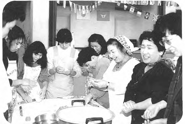
本場の餃子づくりにチャレンジ!!