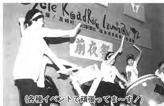
(各種イベントで頑張ってます!)