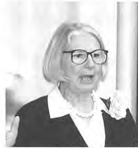
イーダ・ヴァリッチオ

1923年、イタリア人の両親のもと、トルコに生まれる。アメリカ、カナダ、イギリス、フランスなどで世界各国で毎年個展を開催する世界的洋画家。