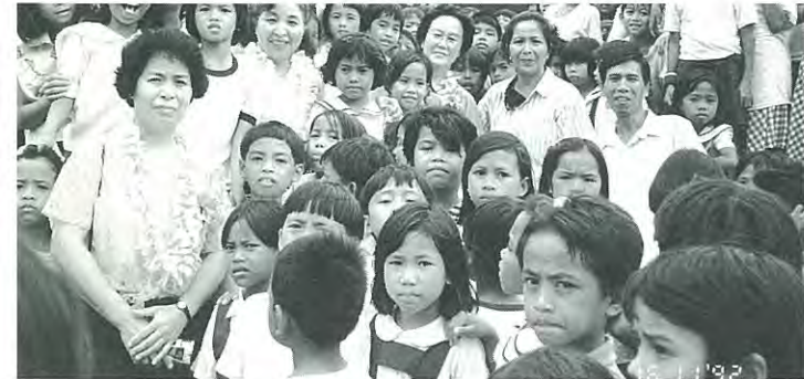
(子ども達にかこまれて……)