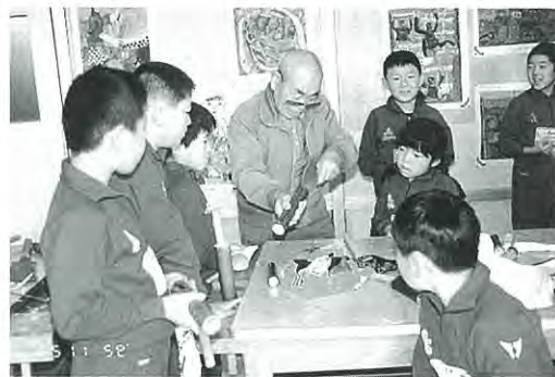
(水でっぼの作り方…みんなの目が輝く…)

う、ゴムパチンコ等古くから伝わり人々に親しまれてきた昔の遊び十二種類の中から子ども達はそれぞれ自分の好きな遊びを選び、お年寄りから道具の作り方、遊び方を手をとって教えてもらいました。お年寄りと一緒に道具を作り、遊び方を教えてもらう子ども達の顔はイキイキとして心から楽しんでいました。