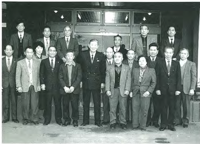
地域福祉の中核機関として…… (新民生・児童委員のみなさん)