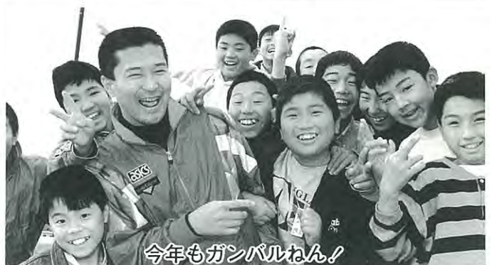
今年もガンバルねん!

このような中で、幼稚園教育は生涯教育の原点として人間形成の基礎を培う上でその果たす役割は重要かつ重大であると考えます。更に研さんを重ね、教育要領の具現化を目指し「臆せず、怯まず、退かす」の気概をもって今年も精一杯精進して参りたいと存じます。