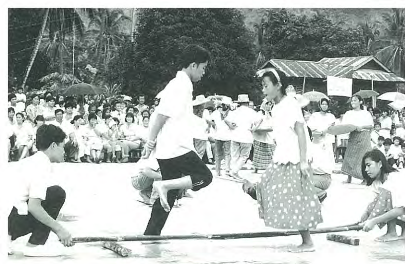
(フィリピンのダンスで歓迎されました。)