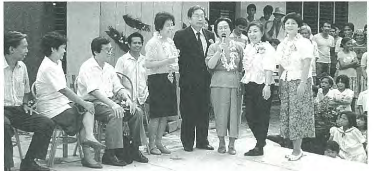
(「紅葉」を合唱……歓迎会で)

小学校長、町長、県議員をはじめ村の長老たちに迎えられてすぐ昼食会場に案内される。余程のことがないと出されないと豚の丸焼が出され歓迎昼食会である。二時から正式な歓迎会が開かれるというのでデシナ先生とバスでニューバタン町の中心地にある郵便局に出かけることにする。十月に送った鉛筆四千本が関税を払わないと受けとれずそのままになっている。PTAにそのお金がないので私が行ってお金を払って受取る訳である。約九百ペリ。日本円で四千五百円を払って学校にもどり直ちに歓迎会場に案内される。校庭をすでに小学生、PTAその他一般の方まで全員が重なるように集っており、木に登っている人までいる。 一段と高い所のイスに座らせられ、フィリピン国旗の下で国歌の斉唱、中学生代表による国に対する誓いの言葉、小学校長のお礼のことばとつづき、私も五人に記念としてニューバタン特製の竹の壁掛けが贈られた。 中学生の合唱。町長のあいさつ、中学生による民族ダンスとつづき、われわれ五人を代表してあいさつを求められたので「デシナ先生がフィリピンに帰えるとき何かお土産をあげたいと言った時に『私のお土産はいいですから、小学生に学用品が欲しい』と言われたので泉崎の小、中学生、婦人団体、企業の方々にお願いして、七千本あつまったうち、千本は七月に送り残り六千本を持ってきた」と話す。 再び村民や先生方の特別な伝統的ダンス