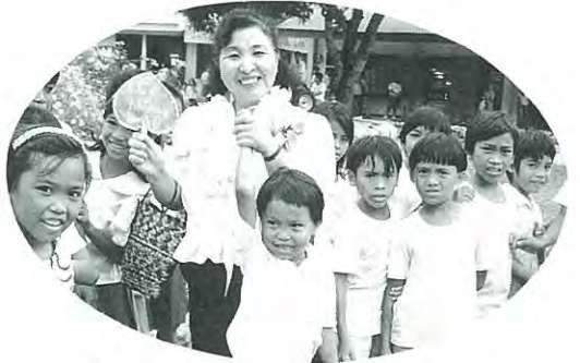
(子ども達の歓迎にニコリ!)