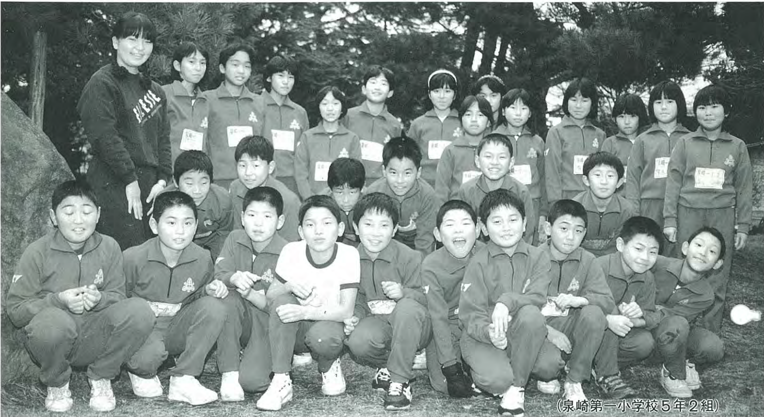
(泉崎第一小学校5年2組)