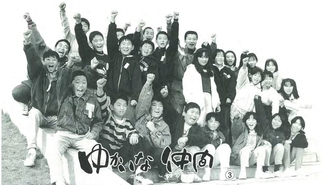
泉崎第二小学校6年1組