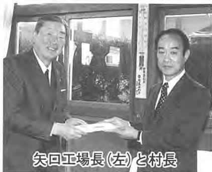
矢口工場長(左)と村長