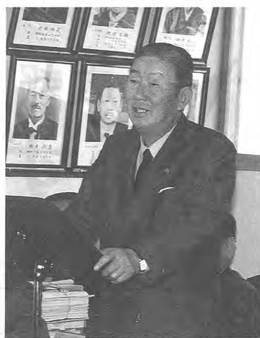
村長：施政方針演説