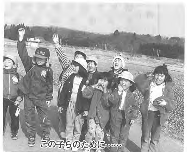
この子らのために……