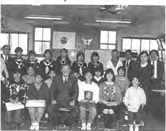
村長を囲み…入賞者のみなさん

する部分としては、芽カキ・ホルモン処理・収穫・出荷だけで済みませす。当社では、シルバー人材の活用、パート雇用などを 実現し、将来は村の主要特産事業に育て豊かな村づくりの主要企業になることが期待されています。