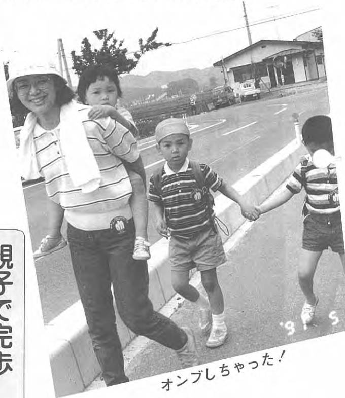
オンブしちゃった!