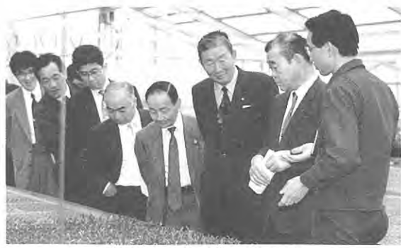
説明にも熱が入ります