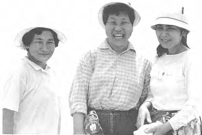
うれしい! ディズニーランドが当たった