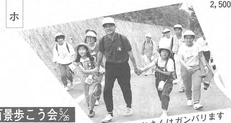
お父さんはガンバります