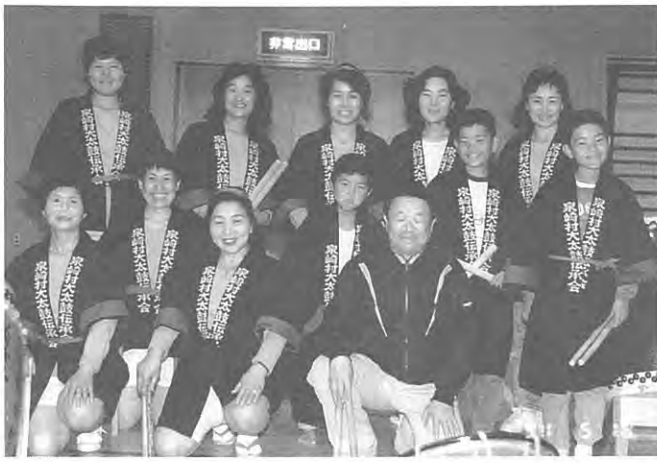
心と体のリフレッシュに最高です……