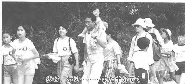
歩け、歩け……まだ半分です