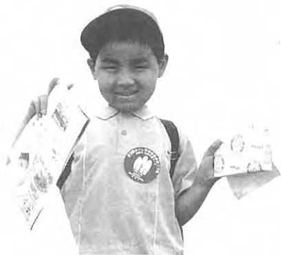
ボクはファミコン!