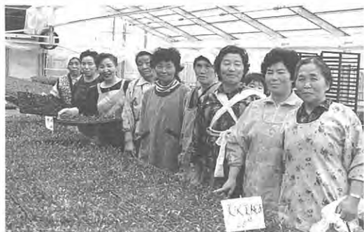
きれいに咲かせたいですネ