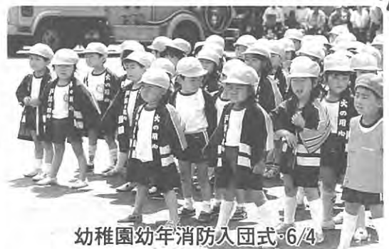
幼稚園幼年消防入団式・6/4