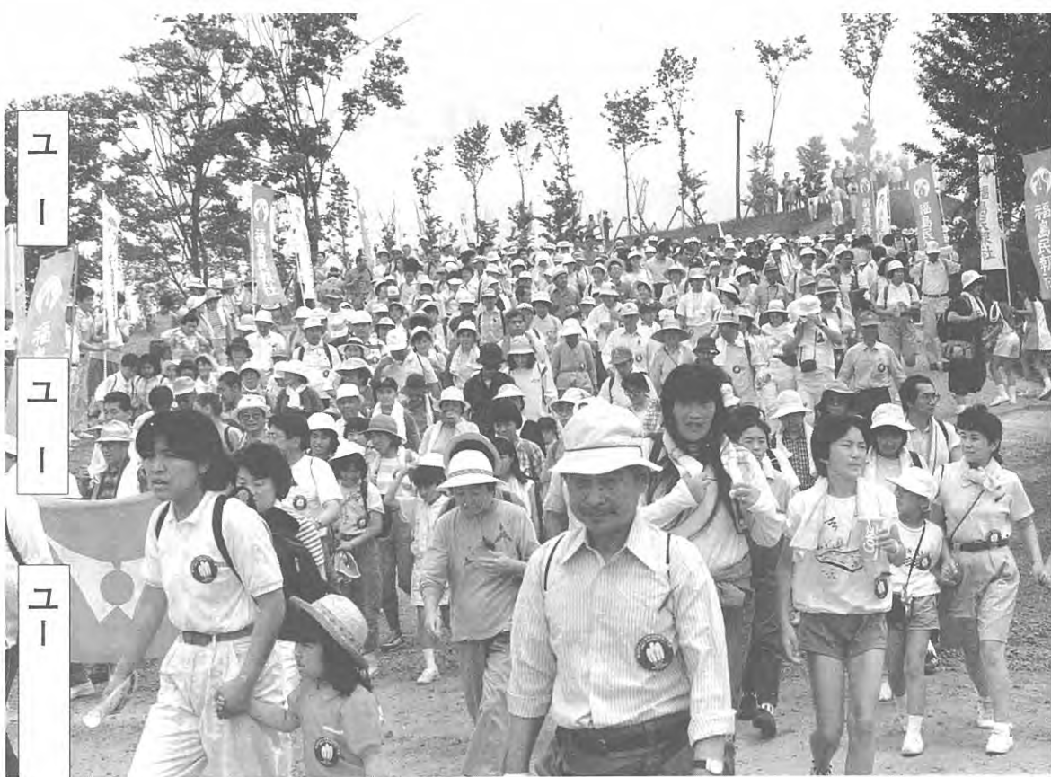
2,500人、いっせいにスタートです