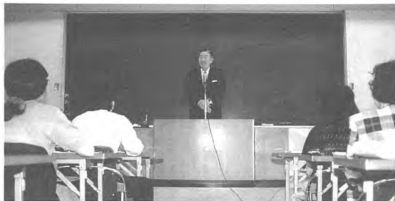
講演する海上村長

この施設の完成により、野菜の生産安定と規模拡大や花卉の新品目導入に大きな力を発揮しています。又、計画的生産・販売につなが