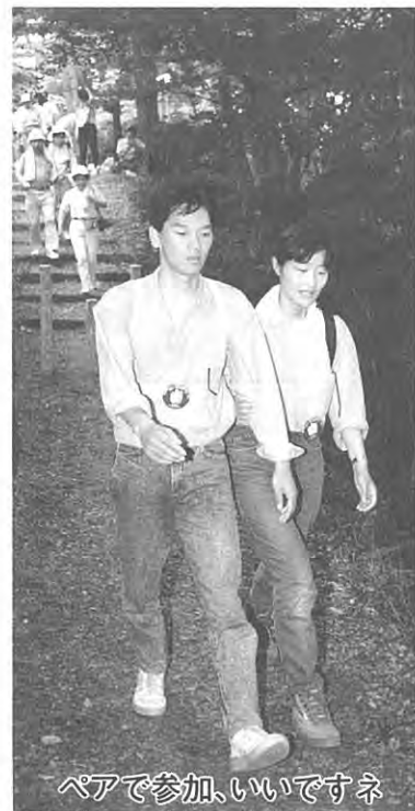
ペアで参加、いいですね