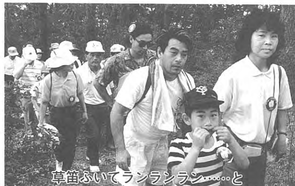
草笛ふいてランランラン……と

々から「えらいねエ」とか「がんばるね」とか声をかけられるとやはり子供はうれしいものです。残念ながらファミコンは当りませんでした、子供達にまた一つ勲章がつけました。