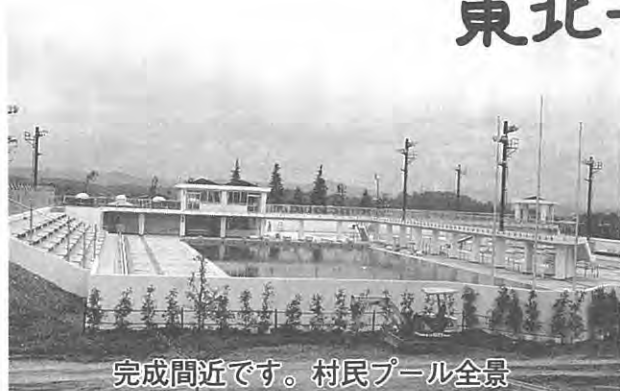
完成間近です。村民プール全景