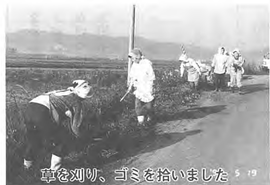
草を刈り、ゴミを拾いました 5/29