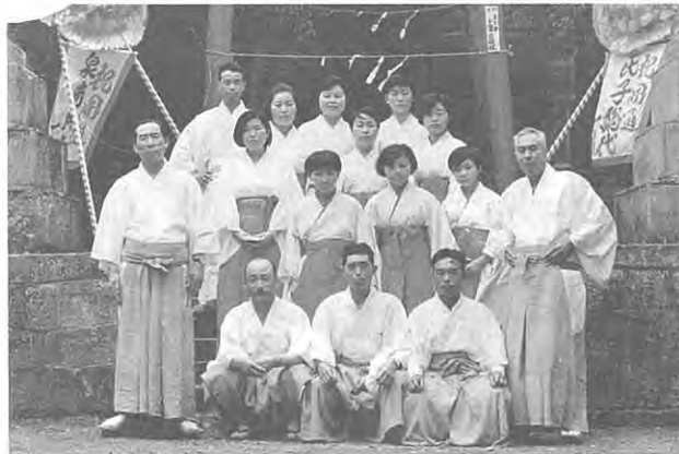
昭和43年のおもいでスナップ