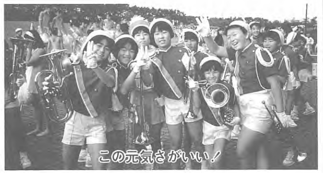
この元気さがいい!

去る十一月三日(日)、岩手県盛岡市で開催された第二十回東北マーチングフェスティバル(主催・全日本マーチング・トワリング東北連盟)に泉崎一小のマーチングバンドが県代表で出場しました。同校は昨年に続いて二回目の出場で、大きな夢のマーチ等四曲をみごとに演奏、惜しくも全国大会出場はできませんでしたが、レベルの向上はすばらしく来年に期待されます。一万人の大観客の前で堂々と演奏する子供たちに、当日、バス一台(六十名)で応援にかけつけた父母のみなさんは目がしらを熱くして感動していました。