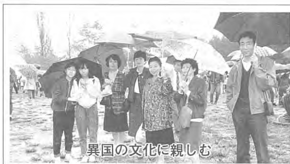
異国の文化に親しむ

去る十月二十七日(日)、仙台市東北大学国際交流会館で行なわれた第六回仙台国際まつりに十六名のみなさんが参加しました。当日はあいにくの雨でしたが、参加者のみなさんは、東北大の留学生が作るお国料理を味わったり、民族衣装、音楽、舞踊等異国文化に接したり楽しい一日を過ごしました。