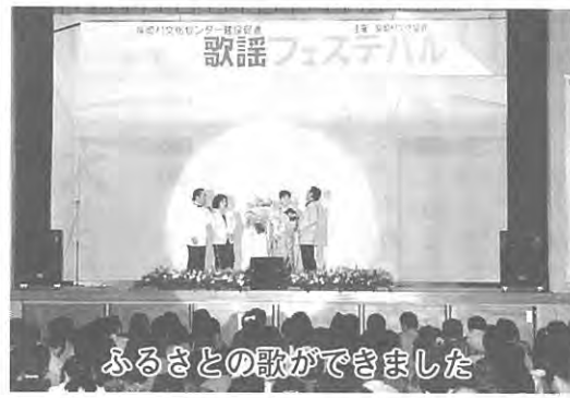
ふるさとの歌ができました

第一部のカラオケの部には二十七人のみなさんが出場、プロに勝るとも劣らないみごとに歌唱力で得意の歌を披露すると会場から大きな拍手、かけ声、ご祝儀がとびかいました。さらに踊りが添えられると会場は一段と熱く盛り上がりました。