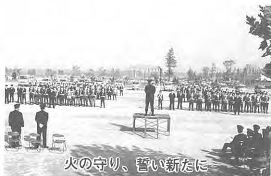
火の守り、誓い新たに