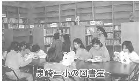
泉崎三小の図書室

私たちが、何気なく借りている本ですが、その本の整理をしてくれているのは、図書委員会の人たちです。図書委員会の人は、一人でも多くの人が本を借りるようにと、手づくりのしおりをくばったりして工夫して活動しています。