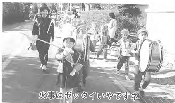
火事はゼツタイいやですネ