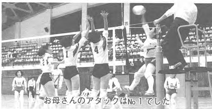
お母さんのアタックはNo 1でした

去る9月28日~29日、青森県総合体育館で開催された第19回東北地区家庭婦人バレーボール親善大会に、わが村の泉崎クラブが県代表で出場。一回戦で惜しくも負けてしまいましたが、メンバーの好プレーに会場からは大きな拍手がおくられました。