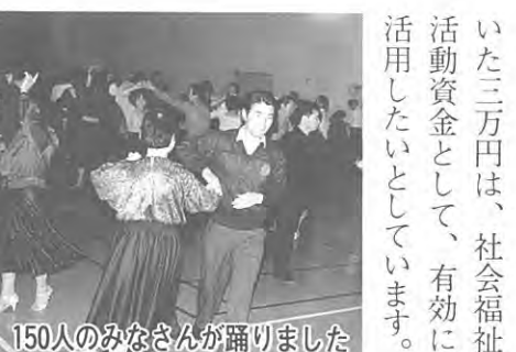
150人のみなさんが踊りました

このダンスパーティーは、去る十一月十六日(土)、泉崎村生活環境改善センターで開催され、同会員のみなさんら百五〇人が参加しました。