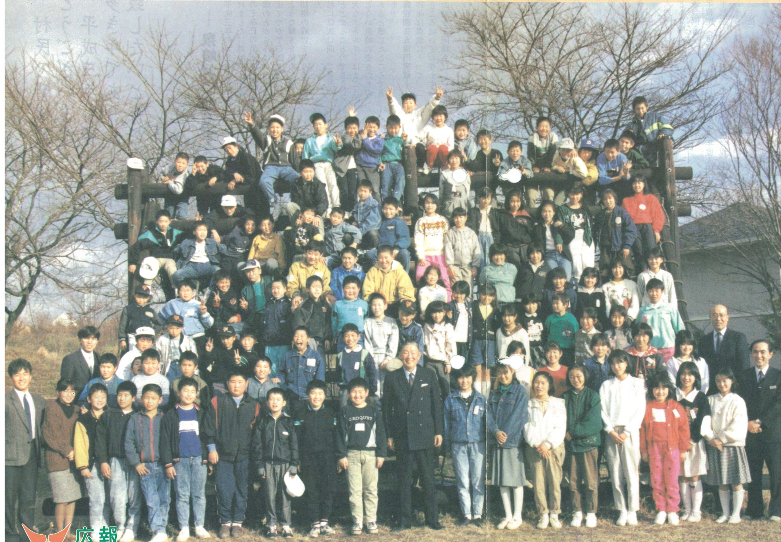
泉崎第2小学校児童と村長

発行・編集/泉崎村役場 福島県西白河郡泉崎村大字泉崎字新道2 TEL 0248-53-2111(代) 印刷/野木印刷所