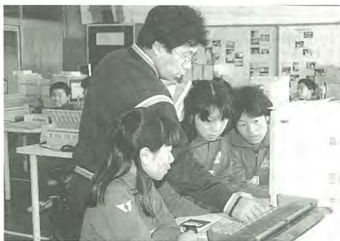
(パソコン学習中……泉一小)

その中学校の前段としての小学校児童にも、コンピュータになじみ、楽しみ、その中で教育効果を高めることは大変重要なことです。このような観点からわが村では両小学校へのコンピュータ導入を実施しました。十一台という数は、四十年学級で、四人に一台、教師用に一台としたもので、中高学年を中心に、全教科のソフトも購入しました。指導にあたる教師のみならずも、自主的研修はもちろん各種研修会に参加し、意欲をみせています。両校のコンピュータ活用教育が大いに期待されます。