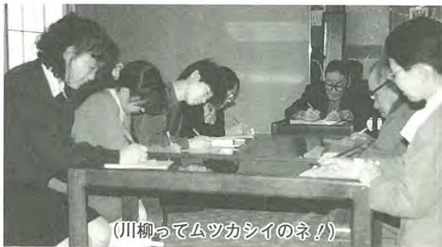
(川柳ってムツカシイのネ!)