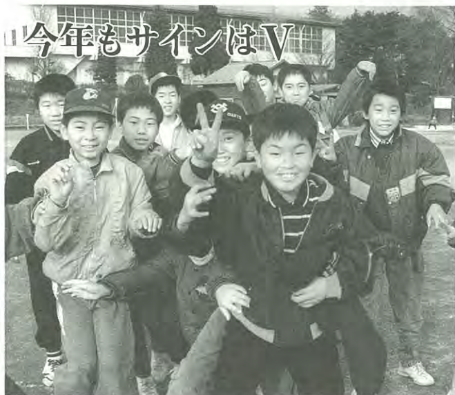
(おもいっきり元気！……泉二小)

ればならいこ れからの社会 に高齢化社会 と教育を無視 することはで きません。 老人の自立 をつくること と併せ生涯教 育の重要性を 考えますと老 人と教育の関 係は義務教育 と同一のもの ではありませ んがその重要