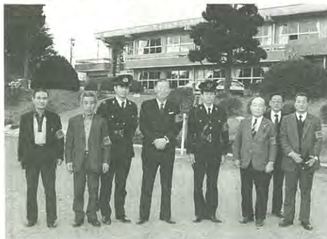
(私達もガンバッテいます。) 村長を囲み 泉崎防犯協会のみなさん。

みんなで防犯に心がけ 暴力団をおそれない 利用しない 金を出さない 「暴力三ナイ運動」を推進しましょう。