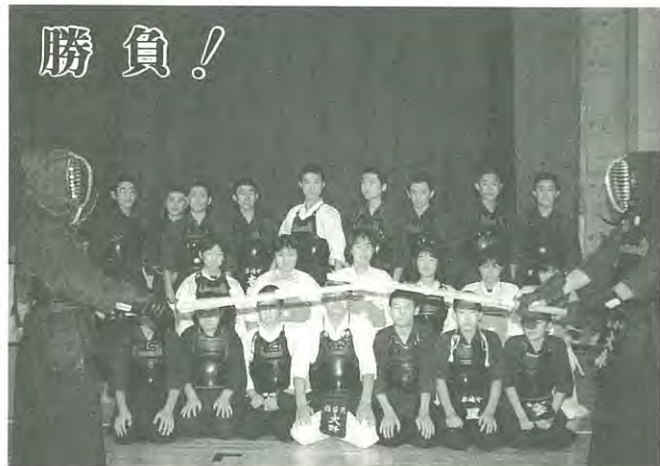
(大野先生を囲んで、泉崎中剣道のみなさん)

核家族化の 傾向が一般化 するとともに 保育や老人の 問題は家庭か ら転じて村づ くりの要素と なってきました。