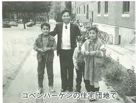
コペンハーゲンの住宅団地で

阿武隈川の清流で泳ぎをおぼえ、柿の木の梢越しに阿武隈の山脈を眺めて成長してきた私にとっての故郷は自然そのものであったように思います。先月、仕事でデンマークを訪れ、悠久の歴史の流れを漂わせている街並や田園風景に強い感動を覚え、日本の急激な変化を比べて、種々考えさせられました。