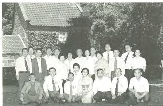
(訪問団のみなさん)

この二人の方が平成二年十一月十五日付で法務大臣から委嘱されました。家庭間、学校、職場内、近隣関係の問題、登記、借地、借家に関する問題等の困りごと、悩みごとの相談に応じ、解決にお役立ちします。