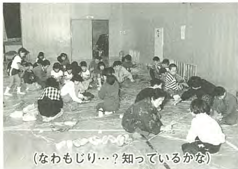
(なわもじり...?知っているかな)

てっぼう、みずてっぼう、竹馬、おてだま、ゴムパチンコ、なわもじり、の班に分かれ、製作にとりかかりました。各種目とも老人の方や先生のごまかい指導によりじょうずに作ることができました。自分たちで作った作品を使って楽しく遊ぶことができました。また六年生のPTA役員の方が