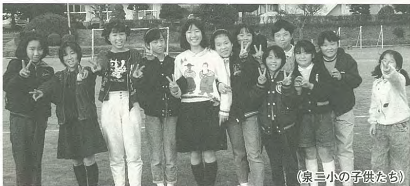
(泉三小の子供たち)