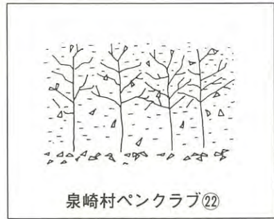
泉崎村ペンクラブ②②

私も都市開発とか街造りの仕事をしている関係で泉崎村と豊かな村造りに興味と期待をいだいております。人と自然と生活とに調和がとれ、しかも将来につながる新しい豊かな泉崎村の誕生を心から祈っております。