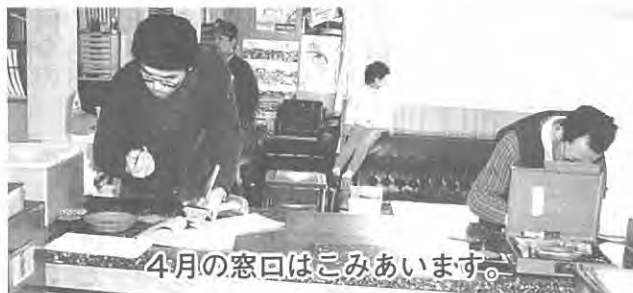
4月の窓口はごみあひます。

☆戸籍、住民票謄・抄本請求の場合は印鑑持参。 第三者が請求する場合は、正当な理由、請求者との関係を明確にし委任状持参のこと。 ☆印鑑証明書を請求する場合は印鑑登録証、印鑑持参、印鑑登録、改印、登録証再交付は必ず本人が申請を行うこと。