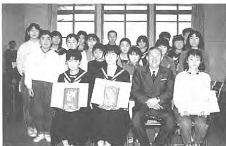
おめでとう! 村長を囲んで入賞のみなさん。