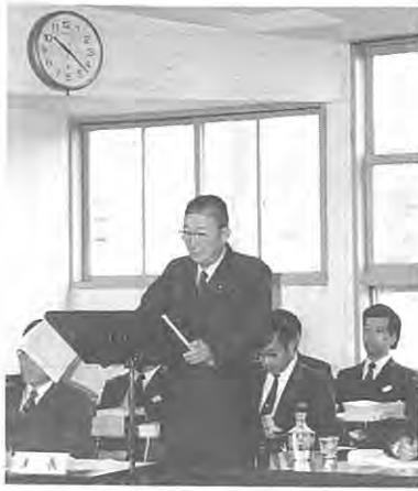
施政方針を述べる海上村長