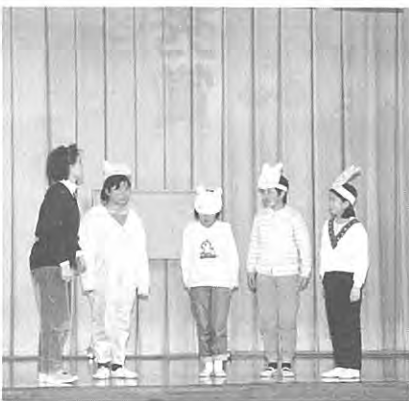
「三びきのこぶた」熱演中！

学校では、平成二年度も、これまでの方法を継続し、国際性豊かな児童の育成を目指していきたいと、しています。