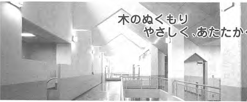
木の特質を生かした校舎：泉崎中学校校舎内部