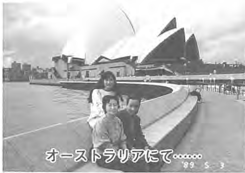
オーストラリアにて.....

トファミリー宅に滞在しました。そこでオーストラリア人の生活習慣の違いに驚き、又感心したり貴重な体験をしました。その後、パースからメルボルン、シドニー、プリズベンと娘の案内で親子三人二十日間あまりの旅を無事終えました。思いきってこの旅行をして本当に良かったと今つくづく思っております。