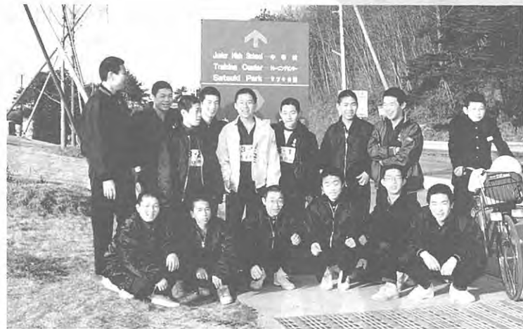
国際社会で活躍シタイ！ 泉崎中生

わが村は、日本一の村づくりを目指すなかで、国際化、国際交流推進を重要施策の一つとして、一早く取り組んできました。わけても教育における国際交流は昭和六十年に泉崎中学校が、県教委より県初の国際交流推進研究校の指定を受けたことを契機に、同年初めて外国人英語指導教師を招へい、以来、毎年外国人英語教師設置を続け、幼稚園、小学生に生きた英会話教育を実施しています。又、中学校での国際交流はアメリカンハイスクールとの交流、国際祭り参加等、活発に行なわれて