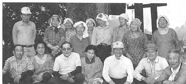
達者がなにより……と会長さん