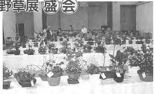
カレンで清そな野草約200点