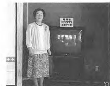
本柳さん、テレビの前で...