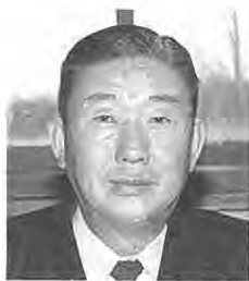
白河地方水道用水供給企業団 企業長

企業団設立年月日 昭和62年11月20日 白河地方水道用水供給事業認可年月日 昭和63年4月15日 計画目標年度 平成17年度 供給開始年度 平成7年度 1日最大取水量 22,900m 3 /日 1日最大給水量 21,310m 3 /日 総事業費 16,935,822千円