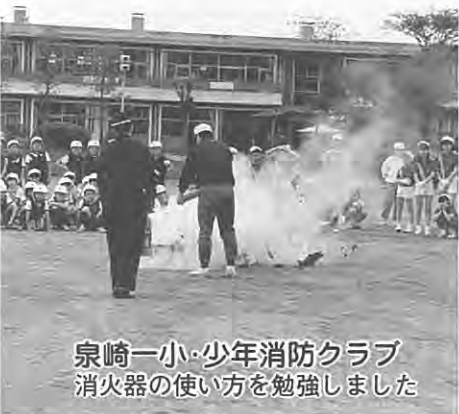
泉崎一小・少年消防クラブ 消火器の使い方を勉強しました