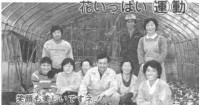
笑顔も美しいですネ!