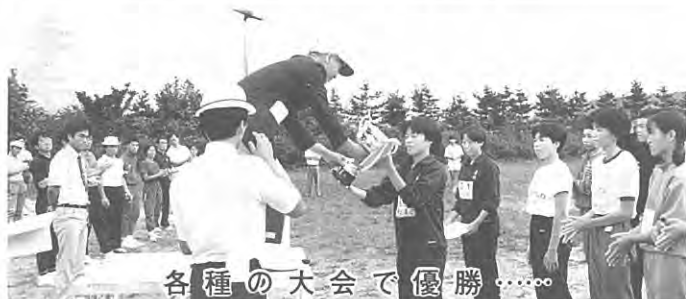
各種の大会で優勝……