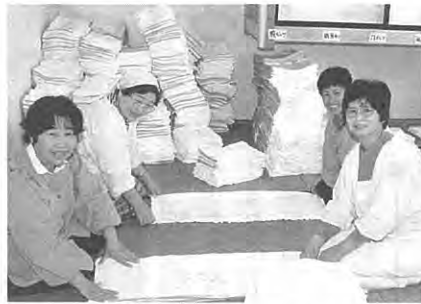
ただいまオムツたたみです……