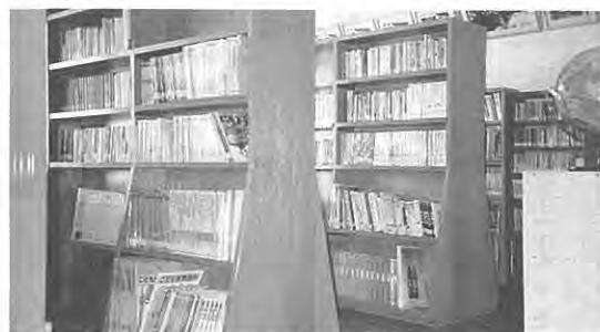
新しい本たくさんそろえました、ご利用下さい。