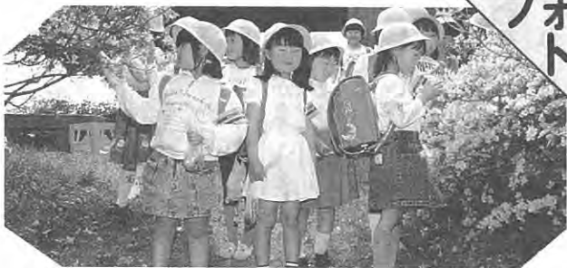
泉崎二小のまはぎが丘はつつじがまっさかり