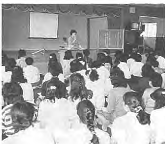
第一回目の学習会