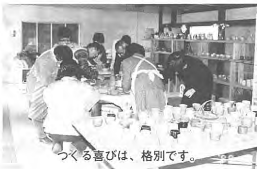
つくる喜びは、格別です。

十二月三日(日)、婦人学級生は、那須町湯本で、陶芸の体験学習をしました。十五名が参加し、「土も生きています」と言う説明があり手に手に粘土を渡されると、思い思いに特色ある形で、世界で一つしかない、作品を造りあげていました。焼き上がった来る日を、皆さん楽しみにし