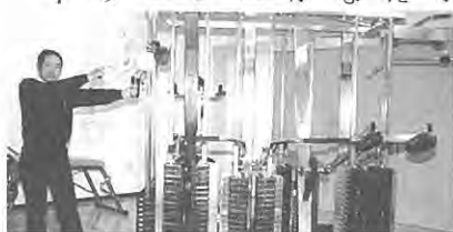
松川指導員が親切におしえてくれます。