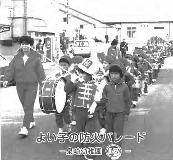
よい子の防火パレード —泉崎幼稚園 11/27—