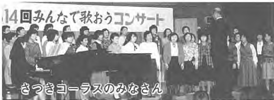
さつきコーラスのみなさん

どちらのクラブも、いつでも入会できます。詳しくは中央公民館へどうぞ。 TEL 531-2258