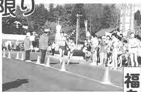
泉崎中継所：タスキをわたす…