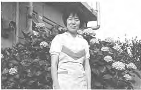
ふるさとのみなさんお元気ですか…

り、新しくなった中学校やちよつと足をのびして陸上競技場なども見てまいりました。童心に帰って、トラックを一周なんてことも：。まわりの見なれた風景が少しづつなくなっていくことは淋しさも感じますが新しくなっていく村にも期待しています。広報「いずみざき」も毎月届くのを楽しみにしています。