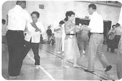
全体のレクリエーション

また年間の活動のことや日ごろ考えていることなどを発表する文集「ことばぎ」も発行いたします。この文集は学級生だけでなく、一般の高齢者の方々も投稿できますので多くの人々が投稿されますよう望んでいます。 高砂学級には、村民の高齢者の人は、誰でも入級できますので生きがいをお求め多くの方々の入級をお待ちしています。