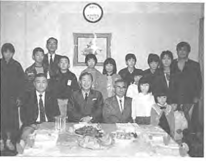
入賞者のみなさん