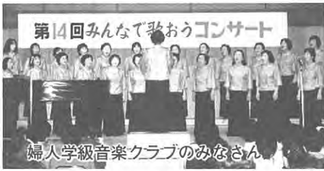
婦人学級音楽クラブのみなさん

一方、結成されてから一年数ヶ月の「さつきコーラス」も、五十名の参加で、会場からは、驚きの声もあつたほどすばらしいコーラスでした。婦人学