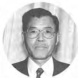
助 役 善 中野 目 辰

卓越した海上村長をいただく泉崎村は、アメニティ事業・ヘルスパイオニアタウン事業・国際交流のまちづくり事業・ホープ計画事