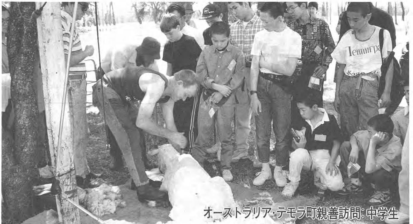
オーストラリア・テモラ町親善訪問：中学生