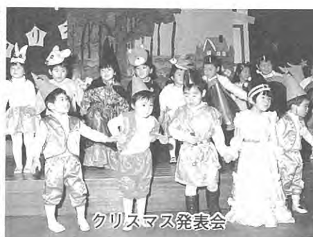
クリスマス発表会