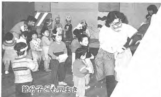
節分子ども豆まき