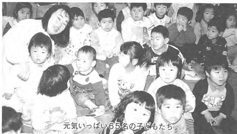
元気いっぱい65名の子どもたち