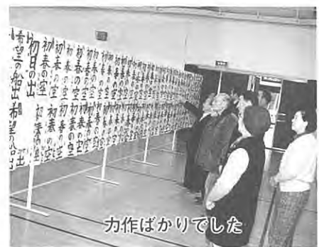
力作ばかりでした