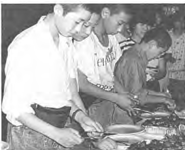
歓迎会はバーベキューで…

年の瀬もおしつまった二十二日、待ちにまつたオーストラリア訪問に、期待と不安が入り交じり九時間の空の旅も団員一同余り話もせず一路シドニーへ。その不安も空港に着き地元の人に迎かえられ一気に解消した。休日を返上して私たちが迎かえてくれたテモラ町の人達の温い心に接し、旅の疲れも忘れかけた。 ほとんどの団員は英会話は自信がなかったが面白い物とかホテルの係員に、ジェスチャーをまじえ英語が通じた時には一喜一憂したものである。計画都市のキャンベラーは、まさにすばらしくその美しさは今でも胸の奥にやきついていて。村民の皆さん、外国を見なくては本当の日本は語れないと思います。