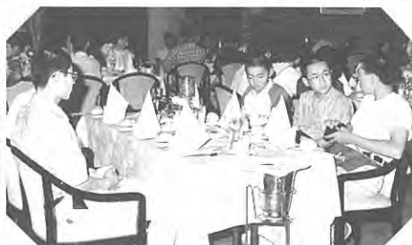
マナーもしっかり守りました。