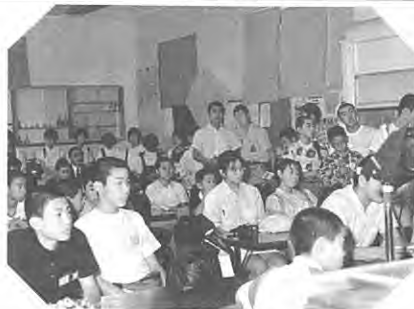
ハイスクール訪問