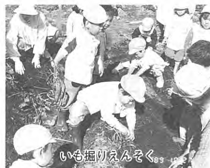
いも掘りえんそく