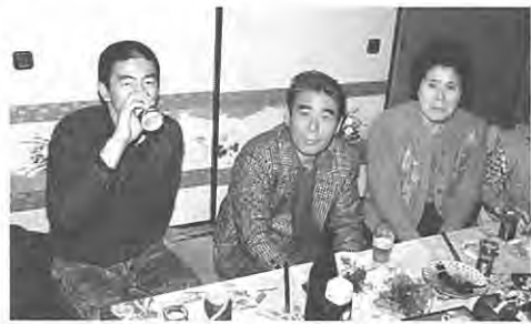
一家だんらんのひととき

となりました。中島村出身の主人と、ニュースが福島のことを報じるとやはり夢中になりますし、毎月送られて来る「いずみざき」を通して、村の活力ある状況を知ることが出来、同時に昔お世話になった方々、幼い頃の友の笑顔を想い出されます。今後も平和で希望あふれる泉崎村でありますようお祈りします。