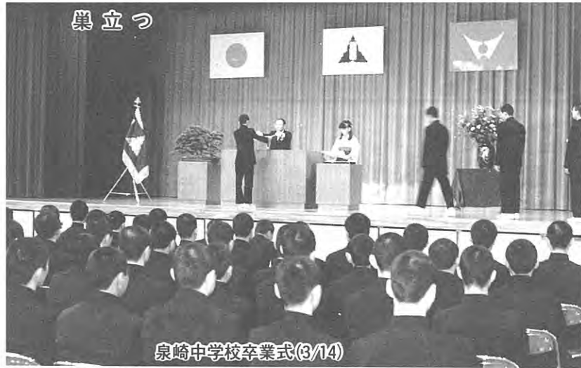
泉崎中学校卒業式(3/14)