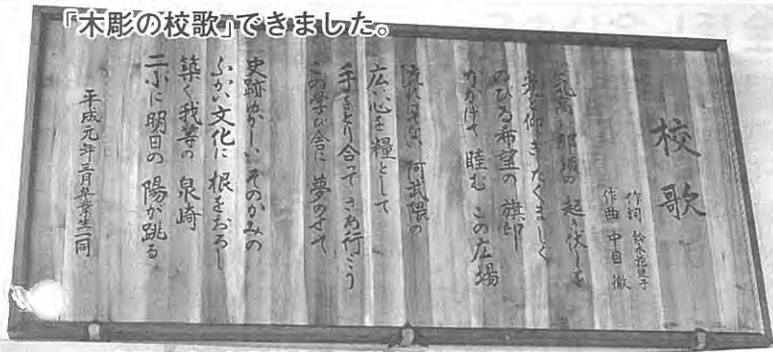
『木彫の校歌』できました。