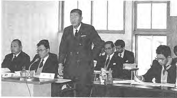
(施政方針を述べる村長)

農業諸問題への果敢な取り組み、駅周辺の開発整備事業、国際リゾート建設事業、中核工業団地造成事業、第二小学校々舎建築事業等、大規模事業の計画着手について意欲的な所信表明がなされました。その概要を次のとおり報告いたします。