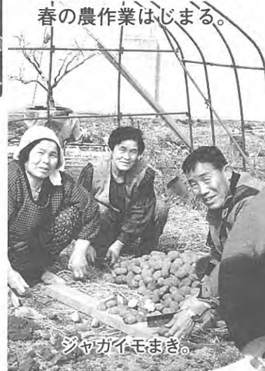
春の農作業はじまる。