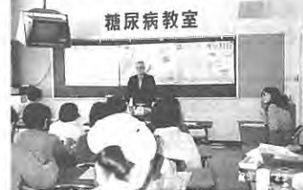
(熱心に学習・体験…)

信を持ったのではないでしょう。講義のあとには「操体」という体をハツラツにさせる運動を行い身も心もスッキリできたようでした。頑張つて続けてみてください。当教室受講希望の方は村立病院にお問い合せください。電話 五三二四一五