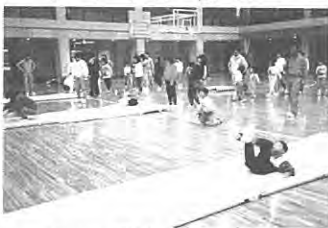
(いい汗流しました。)

親がほとんどでしたが、日頃子供と遊んでやれない親にとっては、子供とのスキンシップや、自分の体力増進に一石二鳥と、大変好評でした。子供も、親と一緒にゲームや、マツト運動と楽しみ親子の絆が一層強く結ばれているようでした。