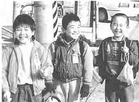
(ボク達交通ルール守ります。)