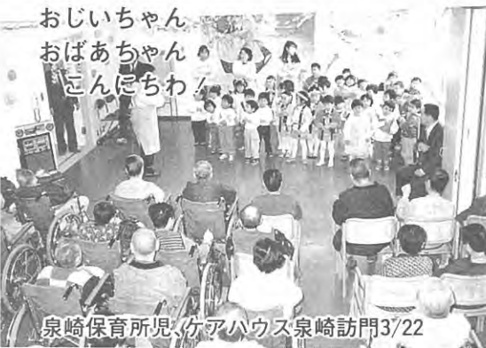
おじいちゃん おばあちゃん こんにちわ