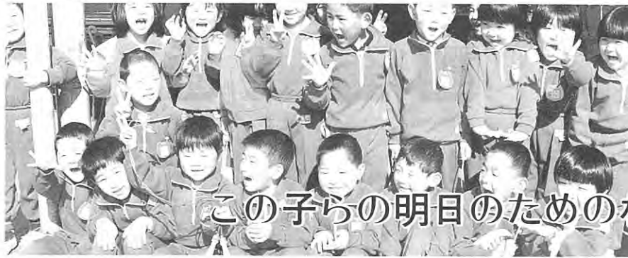
この子らの明日のための村づくり