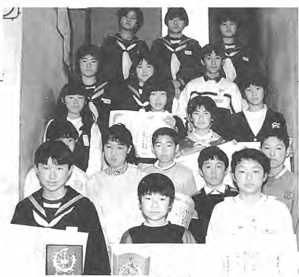
(入賞者のみなさん)