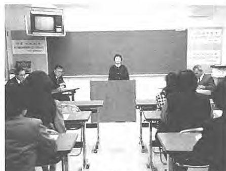
(1年間の学習をおえて…閉講式)

なく、心の豊かさを求めてこれからも楽しく学習を続けていきたい。」と謝辞を述べ昭和六十三年年度の婦人学級を閉じました。