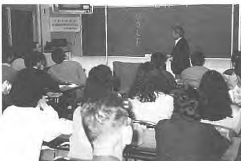
(まず、マナーを学ぶ……)