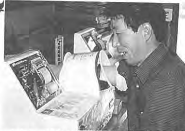
「タウン、絶好調だ。自動血圧測定」