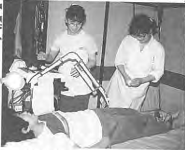
総合検診で健康チェック