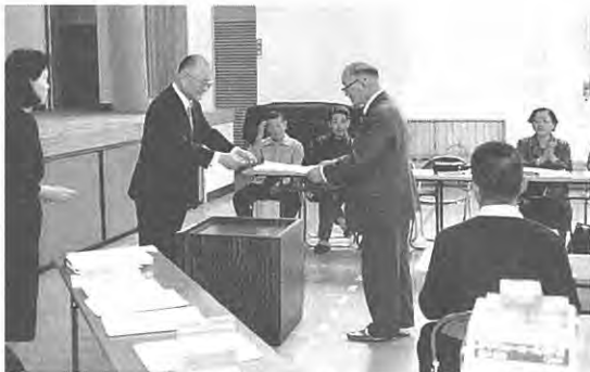
(よくガンバッタデ賞！閉講式)

る四月二十一日閉講式が行なわれました。本人が糖尿病の方あるいは家族が糖尿病の方など多くの人が受講