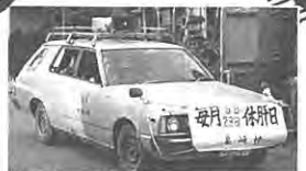
今日は休肝日です、広報車巡回