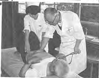
ハイ、ダイジョウブ