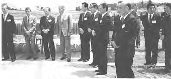
(工事の安全を祈願)