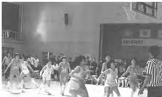
(燃やせ青春!力の限り……)