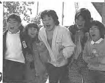
ガン撲滅宣言の村