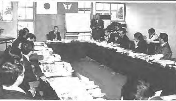
(第一回プレーンストーミング)

泉崎第一工業団地、ニュータウン、中学校新校舎等を視察した後、村長が「泉崎村の村づくり計画について」と題して、これまでの整備経過や今後の計画について報告しました。続いて討議に入り、委員からはさまざまな意見が出されました。本村では昭和五十六年に策定した総合振興計画の見直しを来年に予定しており、検討会の調査結果は、新しい振興計画を策定する上で貴重な資料になるものと期待されます。