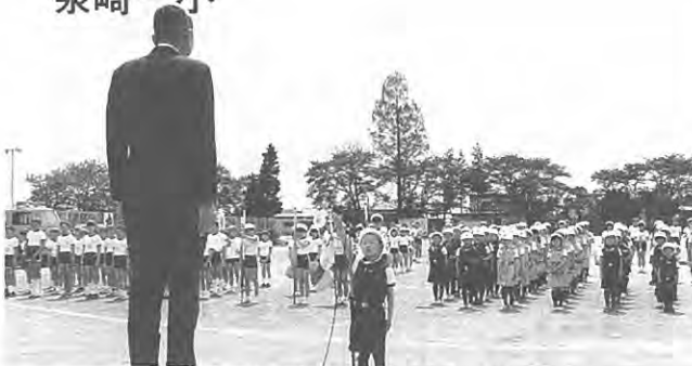
(チビっ子消防隊、力強く宣誓!)