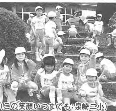
(この笑顔いつまでも・泉崎三小)

見ると田植地獄であった。機械作業は重労働の苦役を見事に解放した。機械文明の進歩が人生八十年に貢献したと農村では見られなくもない。日本は長寿国世界一といわれるが村民みんなの努力で泉崎の長生きに挑んでみたい。長寿国だから長生きできると思っている人が多い。たしかに長生きはふえていく。しかし平均余命が伸びるといふことは赤ちゃんや若い人が死ななくなったのが大きな理由だ。明治二十年のわが国初の統計では六十五才以上の平均余命は十年であった。ざっと百年後のいまのそれは十四年だそう。一世紀で四年しか伸びないことになる。「保健指導や医療が伸ばした寿命は百年かかって四年だ」という厳しい見方もできる。現在八十五才以上の長寿は