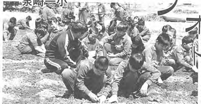
(体験学習：さといもまいたヨ!)