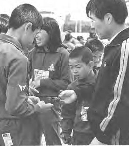
(体験学習・ふれあい学習:泉一小)