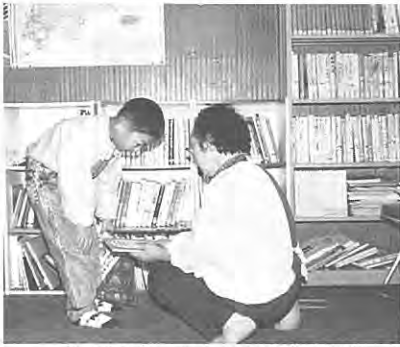
(おばあちゃんもボクも本大好き!)

このような目標を持ってば親子のふれ合いも深まり、知識向上ともなり、一石二鳥です。そのお手伝いとして、図書館では、新しい本を講入いたしました。