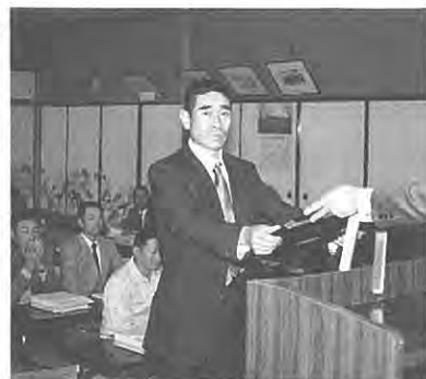
(おめでとうございます)