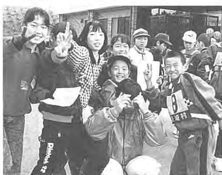
(楽しかったウォークラリー)：第1回健康まつり

なお長期間継続して歩行を実行しているグループ又は個人は健康まつり式典の際に表彰されます。