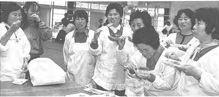
(健康食コーナーで……：第1回健康まつり)