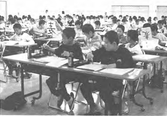
(上手にかけたかな?)