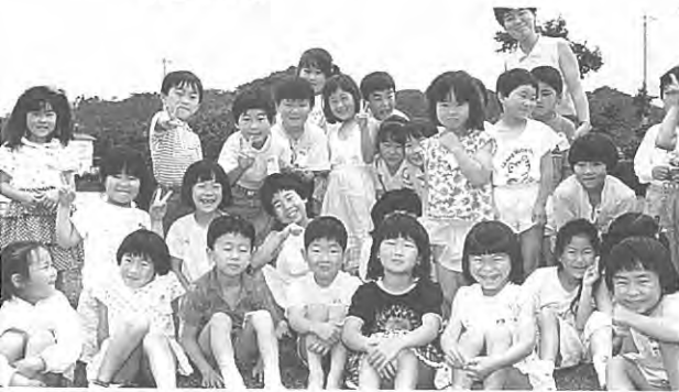
(ボク、頑張るヨ!...泉一小)