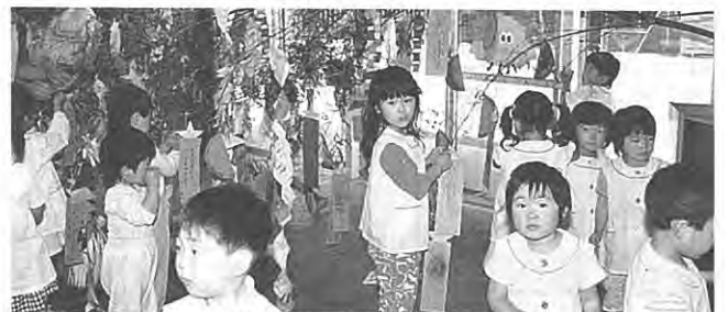
(保育所の子どもたち)