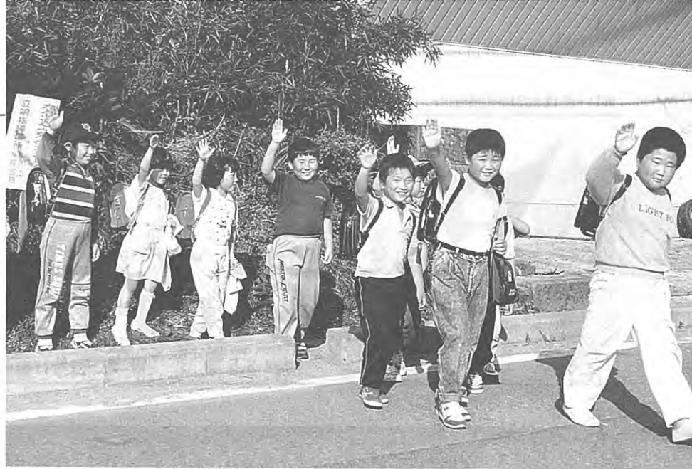
(ボク達、交通ルールを守ります。)