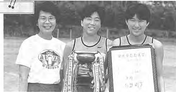
(佐藤先生と一緒にニコリ……)