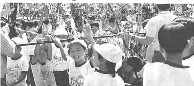
(泉崎一小的みなさん)