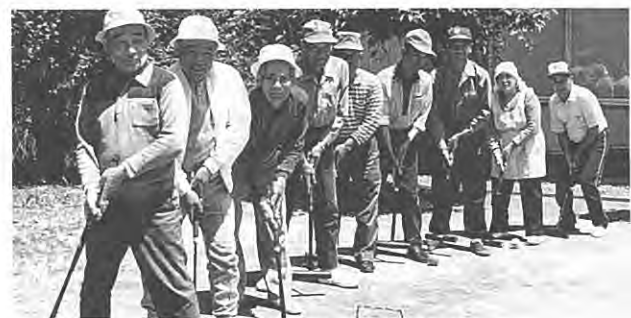
(交通事故をフットバセ!)

では、お年寄りが交通事故から身を守るために心がけることは何でしょうか。一番大切なのは、“己を知る”