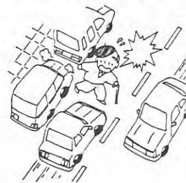
車の直前・直後の横断はしません。