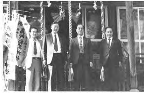
友田副知事・右から2番目