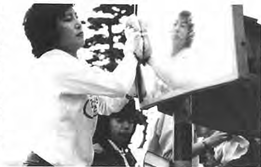
▶カーブミラー清掃中の学級生

青年学級では、五月二十二日村内のカーブミラーの清掃や道路沿の空かん拾いなどをして村内の美化に努めた。今回の参加者は、二