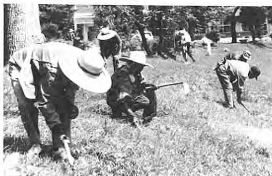
奉仕作業中の老人会