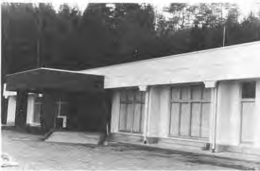
老人福祉センター

一方的設計その他各種の法的問題も解決し、また買受け希望等の調査など準備的作業も大方について結着を見ましたので五十八年は着工第一年を迎えることがで