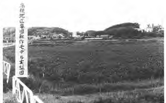
高根地区集団転作モデル実証園

とり組みを進める所存であります。転作問題は農家の皆さんのご協力によって年々その面積も増加の方向にあります。集団化、団地化の比率が低く、転作奨励金の合理的確保と有機的農家経営の確立の面から五十八年においても団地化、集団化を一そう進めて参りたいと考えます。団地化については五十七年は転作面積一〇六ヘクタールに対し、五団地十六ヘクタール、計画加算地区は十地区五十九ヘクタールと奨励金の加算額増加に一步進めたのであ