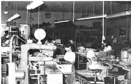
松竹無線株式会社

地域全体が近代化して参りますとそれに見合う商工活動が盛んになります、このため村は、本村交通の優位性を軸に、ここ数年間、順次企業の導入に努めてきたところで、昭和五十七年度は新たに二社の操業にこぎ