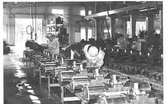
株式会社コーシン精工

つけたのであります。五十八年以後に於ても段階的に導入を図っていく計画であります。二次産業の発展は雇用の機会を創出し、所得構造の面で飛躍的充実へと