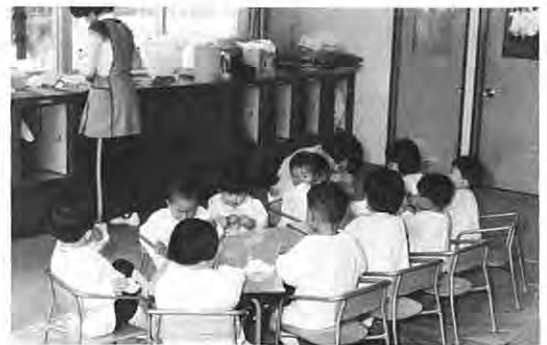
保育所（小さな村民のために）

健康に生き快適な生活ができることが住民の願いであり、行政もまたそのためにあります。皆さんで生きがいと幸せを求めながら進む泉崎村、人を育てる文化をつくりそしてその営みがさかんである泉崎村、わたしたちの村にはそうしたものの創造の力が他のどの村よりも立派に脈打っています。教育に、スポーツに医療に、老人の対策に、保育を要する小さな村民もすべてそれぞれの領域で精一杯の活動がなされております。私の就任以来の前半は「福祉の施設」をめざす期間でありました。これから、施設を高度に活用する幸せをスタートする「福祉享受」の時期にしたいと考えております。