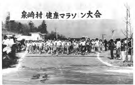
泉崎村 健康マラソン大会