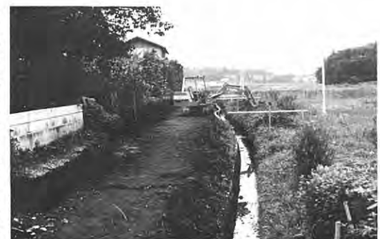
整備される古内線