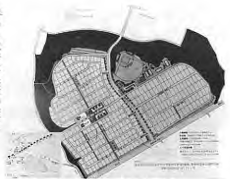
東地区住宅団地区画計画図

を合いことばに豊かで明るい村づくりをめざして取り組んだ新農構改善事業もその取り組みを進めて参り、昭和五十八年は、実施第二年度を迎えることになりました。また、ここ数年にわたって協力をいただいた東地区住宅団地の造成への着手、カントリーパーク（運動公園）等の実施も五十八年の課題として進めることとなります。これをまずもって申