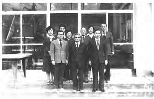
教育委員会・中央公民館

村民の皆様明けましておめでとうございます。昨年中のご懇篤なるご指導そしてご援助を賜りましたこと深く感謝申し上げます。私は、かつて経験したことは全く異質の村教育行政に携わって二度目の新年を迎えることになりました。特殊な事例を除いては、二