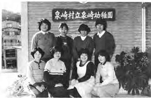
幼 稚 園