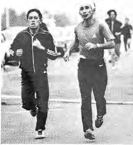
成人病予防はまず運動から