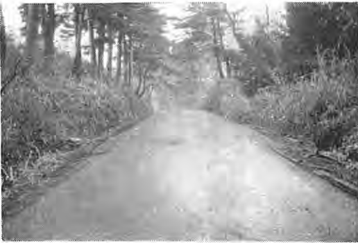
【写真説明】 舗装工事が終りつぱになつた村道踏瀬町中線