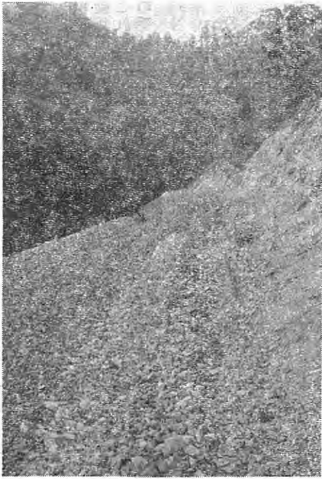
<写真は林道終点附近より 鳥峠をのぞむ>

関平峠線林道完成 関平木野内地内から峠中腹に至る林道峠線の第三期工事が完了し延長約一三〇〇米、平均市員三層六〇の立派な林道ができた。この林道は俗に木ノ内山といわれる一帯の林産資源の開発に果す役割は大きく、今後の利用が望まれます。