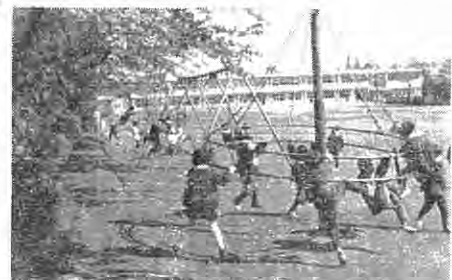
幼稚園児の遊び「開園後一ヶ月余だが子ども達の動作ものびのびと遊んでいる。言葉もおとなになった」父兄の話