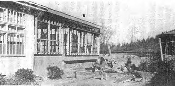
【中学校の理科教室】