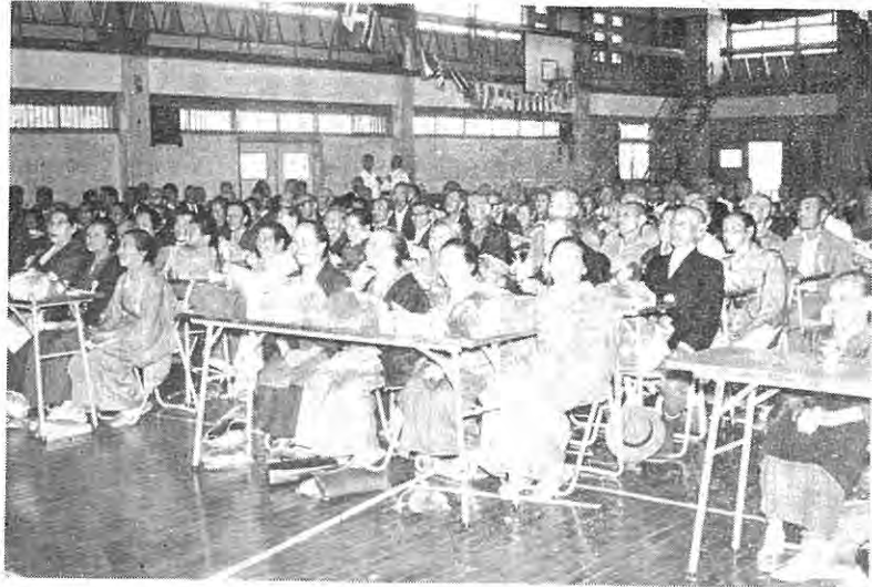
【笑顔のおとしよりたち】

24 17 10 9 1 日 日 日 日 日 降 貯 目 ツ 寒 共 霜 蓄 の の ポ ヲ 露 同 の 日 日 霜 北 募 日 日 日 降 方 金 霜 日 日 霜 方 始 霜 日 日 霜 方 始