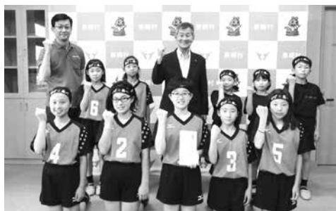
気合のガッツポーズ

女子の部で県大会出場を決めた泉崎バレーボールスポーツ少年団は、出場に先立ち6月22日(金)に村長へ出場のあいさつに訪れ、激励金が交付されました。