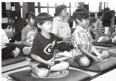
坐禅を組む子ども達

「お寺」という、非日常の空間で、静かに坐禅を組み「心のモヤモヤ・イライラ・ソワソワ」との付き合い方について、考える機会になりました。また、木魚やリンを叩いたり、釣り鐘を鳴らして、響き渡る音色に聞き入ったりと、貴重な体験ができました。