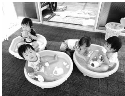
冷たくて気持ちいい～（保育所）