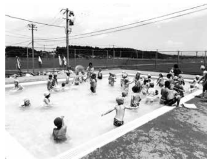
幼稚園のプール開き

また、保育所でも6月中旬から、各クラスでプールを利用した保育が始まり、子ども達は気持ち良さそうに水遊びを楽しんでいました。