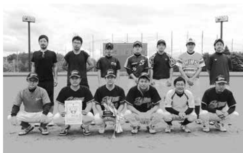
優勝した関和久支部