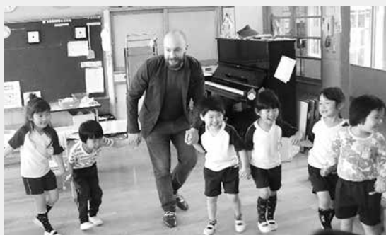
幼稚園毎週水曜日「英語であそぼ」

泉崎村を離れるのは、とても寂しいですが、自分の国に帰っても福島県と泉崎村の人々の優しさや素晴らしさを周りに伝えていきたいと思えます。