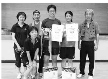
優勝した八雲支部