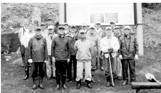
ボランティア参加者の皆さん