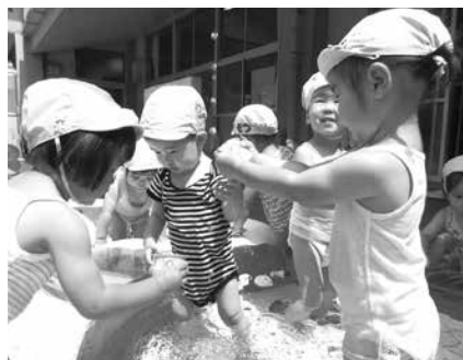
保育所のプール開き