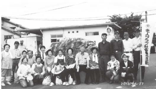
宿館老人クラブの皆さん