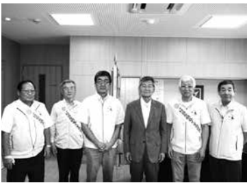
白河地区保護司会の皆さん

7月2日(月)白河地区保護司会の方々が役場を訪れ、犯罪のない明るい社会作りを求め、内閣総理大臣及び福島県知事からのメッセージが伝達されました。