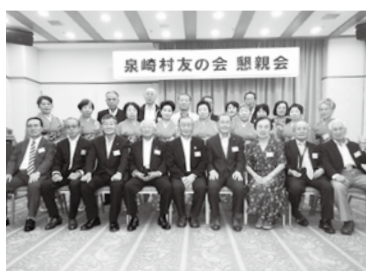
泉崎村友の会総会の様子

総会終了後に懇親会が開催され、村から参加した「峠節保存会」の方々による踊りや、会員によるカラオケが披露されました。最後は、参加者全員で「峠節」を唄と太鼓に合わせて踊り、盛況のうちに終了しました。