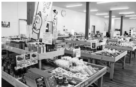
直売所の加工品コーナー