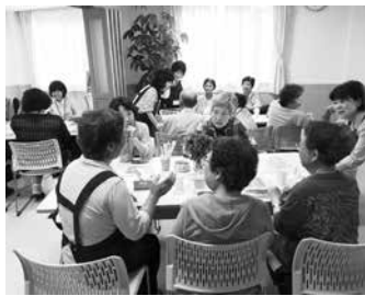
初めてのつながるCafé

今後も、認知症への理解を地域に広げ、人々とのつながりを育みながら、認知症の人をともに支える仕組みづくりができるよう、「つながるCafé」を拠点として活動を続けていきます。