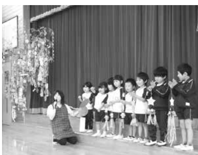
願い事を発表する園児

短冊には、一人ひとりの純粋な願いが書かれ、願いや夢を持つことが次の成長のステップに繋がっていると感じます。