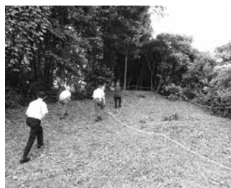
委員による原山古墳群視察