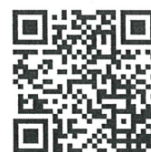
〈動物愛護センターHP〉