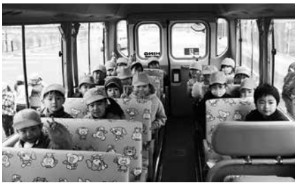
新しいバスの乗り心地を確かめる園児