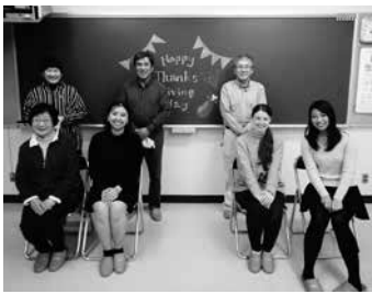
親睦を深めることができました

11月18日(水)中央公民館でアダルト英会話教室のサンクスギビングデー親睦会が開催されました。アメリカとカナダでは祝日であるサンクスギビングデーに食事を開き、家族や友人と一緒に過ごす習慣があり、当教室でもサンクスギビングデーに合わせ、その文化について学びながら先生と生徒の皆さんが親睦を図りました。