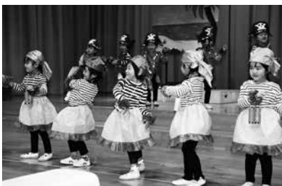
ごっこ遊び「うさぎ一家の大冒険」