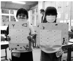
出来上がった作品と記念撮影