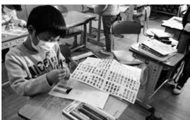
世界の国旗を調べながら色塗りをする様子

運営委員の皆様には、これまでの活動の内容に関するご意見やこれからの活動に関するアドバイスやご要望をいただき、大変有意義な時間となりました。