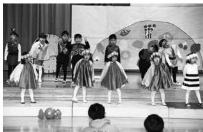
劇あそび「アリとキリギリス」