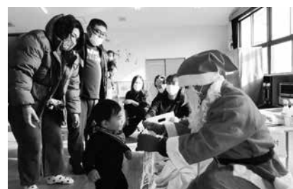
サンタさんプレゼントありがとう