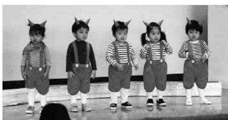
小さなつのがかわいい 「おにのこ にこちゃん」