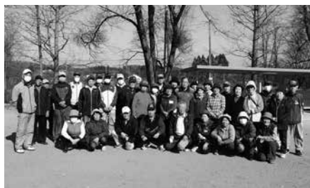
今年最後のプレーを楽しんだ皆さん

お家の方を前に緊張してしまふ姿が見られましたが、最後まで可愛らしく元気いっぱい発表していた子ども達です。最後にサンタさんからプレゼントをもらい、素敵な笑顔を見せてくれました。