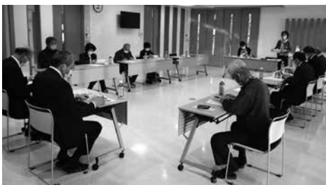
運営委員会の様子

また、放課後子ども教室では、子どもの活動を支援するサポーターを募集しております。性別は問いません。子ども達とともに活動することに興味のある方はぜひ、放課後子ども教室事務局(資料館生涯学習係…53・4777)までお問い合わせください。