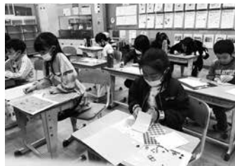
シールアートにチャレンジする児童

児童からは、「初めてのシールアートで難しかったけど楽しかった」「丸いシールがこんな作品になるなんて面白い」などの声があがりました。ご協力をいただきました、関係者の皆様に心より感謝申し上げます。