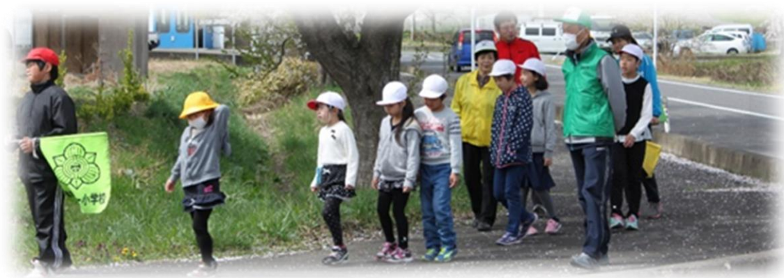
スクラム応援隊による朝の立哨活動