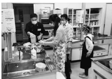
指導を受けながら調理する参加者