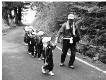
自然を守る会の方と一緒にハイキング

達からは、「おじいちゃんとおばあちゃんと一緒に歩いて楽しかった!」「くじびきが楽しかった!」「カレーがおいしかった!」「今度はお家の人とくるね」という言葉が聞かれました。 鳥峠の自然を守る会の皆様を始め、たくさんの方々のご協力により、とても素敵な時間を過ごすことができました。ありがとうございました。