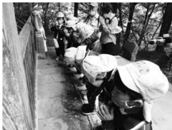
本殿で手を合わせる子ども達