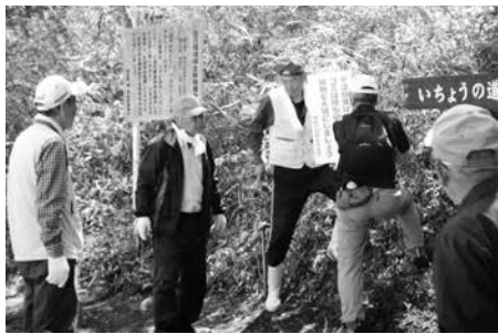
看板を設置する会員の皆さん

鳥峠の自然を守る会では、鳥峠の利用者が安全で快適な登山・ハイキング等の活動ができるよう、日々活動を行っています。