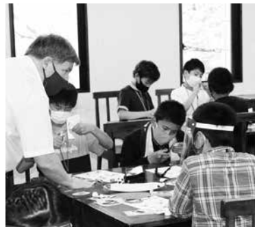
飾り絵制作に取り組む児童達