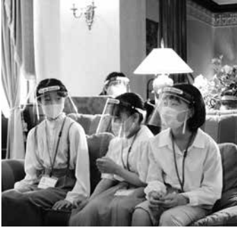
ふかふかのソファでひと休み