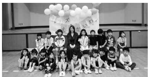
キッズ英会話教室開講式