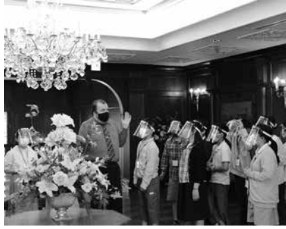
豪華な調度品に興味津々