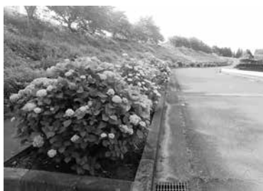
きれいに咲いたアジサイ