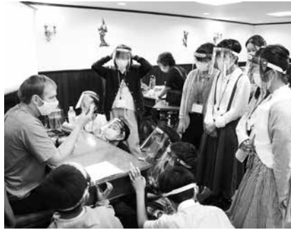
先生の話に真剣に聞き入る