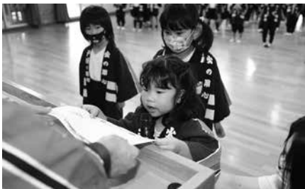
認定証を受け取る新団員

これからも幼年消防クラブ員として火の用心を呼びかけ、防火の意識を高めていきたいです。