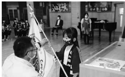
泉崎中島分署長からクラブ旗贈呈