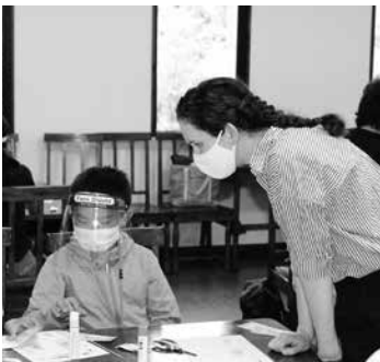
制作中も会話は英語です