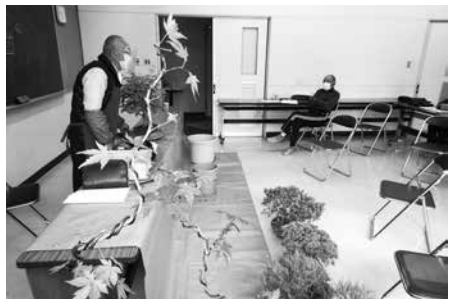
遠藤先生による技術指導の様子

受講生自身が所有している松やさつき、紅葉等を持ち寄り、先生の指導の下、美しく整えることができます。興味のある方は中央公民館までお問い合わせください。