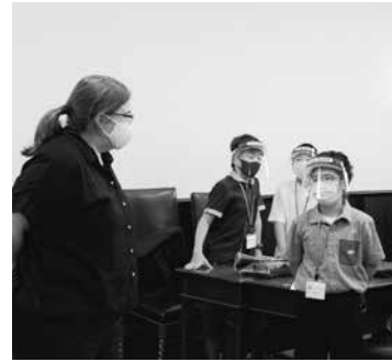
質問に精一杯の英語で答える