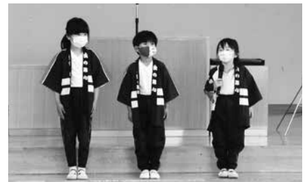
代表園児によるお迎えのことば