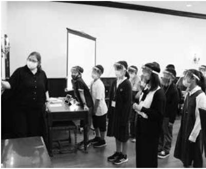
英会話のレッスンを受ける児童達