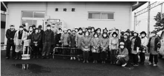
除草作業を行った奉仕団員と民生児童委員