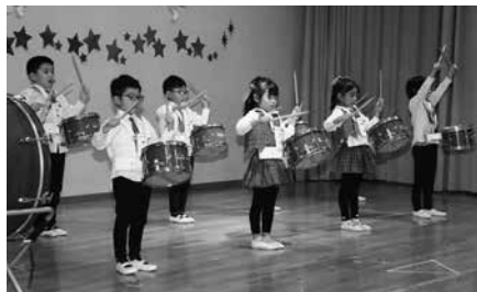
年長合奏「ドラゴンクエスト」他