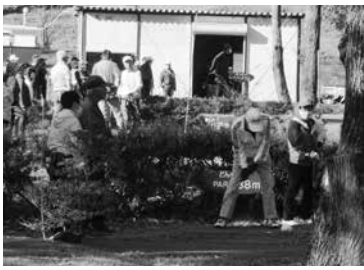
白熱した大会の様子