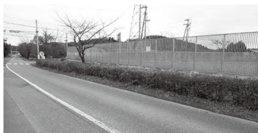
剪定されたさつき