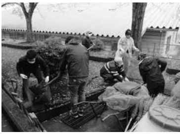
清掃活動を行う会員の皆さん

泉崎村ボランティア連絡協議会は、6団体と個人会員19名で構成されており、鳥峠の清掃・村民文化祭での協力など地域事業のボランティアに積極的に参加しています。