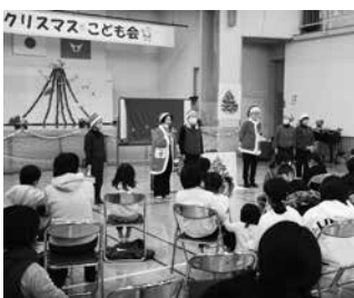
いずみざき語りの会のみなさん

最後には子ども達にサンタさんからプレゼントが手渡され、ひと足早いクリスマスを満喫していました。