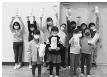
落ち葉を使ったランタン完成！

今回は、放課後子ども教室のサポーターに加え、いちよの会の皆さんにもお越しいただき、多くの地域の方々と触れ合う時間にもなりました。ご協力をいただきました皆様、ありがとうございました。