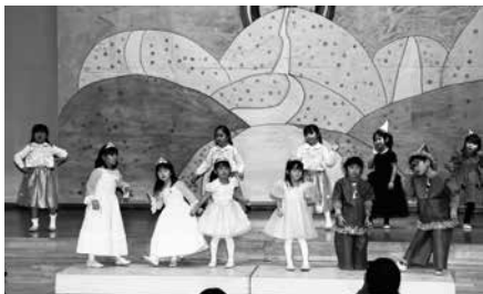
年長劇「オズの魔法使い」