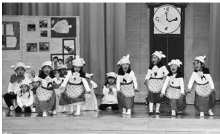
年少りす組「おおかみと七ひきのこやぎ」