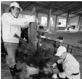
門松造りをする会員

完成した門松は、役場・幼稚園・公民館・カントリ・ヴィレッジの玄関先に会員たちによって飾られました。