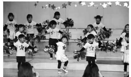
年中最も組「歌っちゃお★踊っちゃお」