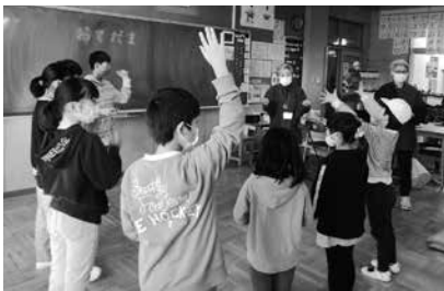
お手玉を教わる児童

泉崎村ボランティア連絡協議会では、会員同士で情報交換をしたり、若い世代の加入促進をしたりと、自発的に活動を展開しています。