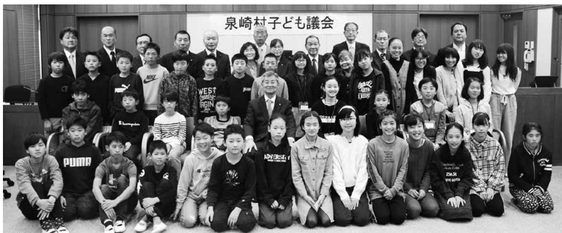
泉崎第一小学校の児童