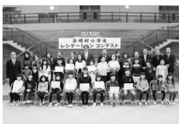
練習の成果を出し切った児童たち