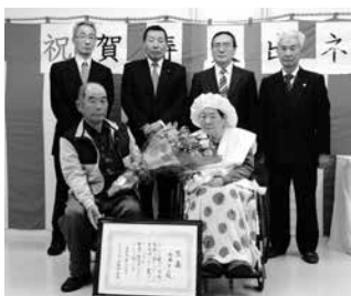
100歳おめでとうございます

ケア会長谷部理事長が出席し、知事賀寿や村長賀寿、記念品、祝金等の贈呈が行われ、ネンさんの長寿をお祝いしました。これからもお元気で長生きしてください。