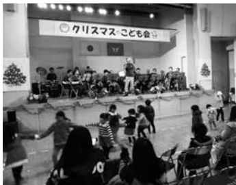
演奏に合わせて踊る子ども達

また、最後にサンタさんから子ども達にプレゼントが手渡され、ひと足早いクリスマスを満喫していました。