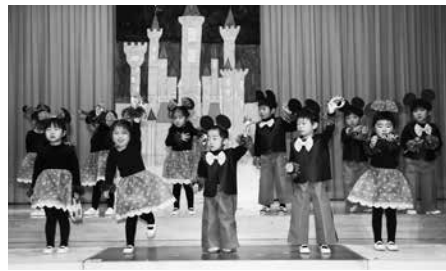
年少・小さな世界、ミッキーマウスマーチ