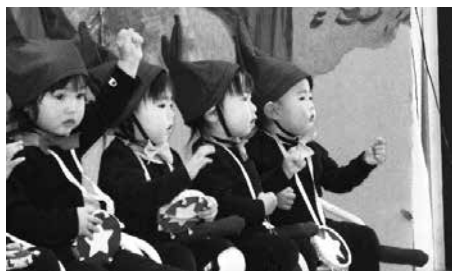
上手に発表できたね

最後にサンタさんの登場で会場は大変盛り上がり、子ども達へプレゼントが一人ずつ手渡され、笑顔いっぱいの子ども達でした。役員と職員によるリズム「ジャンボリミッキー」も大変好評でした。ご協力いただいた役員の皆さんありがとうございました。