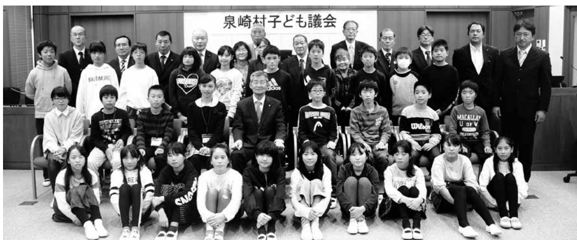
泉崎第二小学校の児童