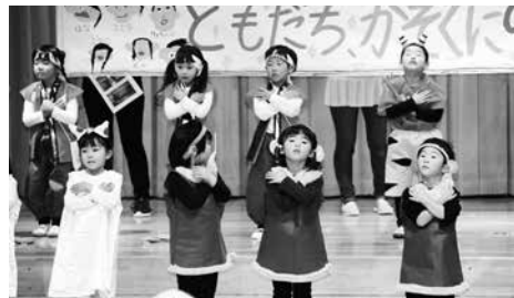
年中・ももたろう