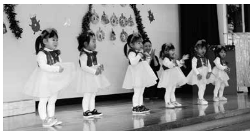
白雪姫役の子ども達

最後にサンタさんの登場で会場は大変盛り上がり、子ども達へプレゼントが一人ずつ手渡され、笑顔いっぱいの子ども達でした。役員と職員によるリズム「ジャンボリミッキー」も大変好評でした。ご協力いただいた役員の皆さんありがとうございました。