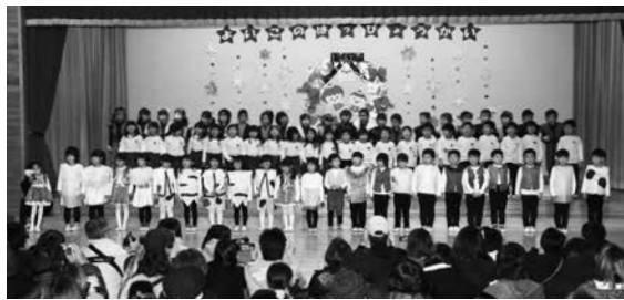
おわりのことば (年長児全員)

元気に発表する姿から、大きな成長を感じる事ができました。発表会で成し遂げた経験は大きな自信となりました。今後の園生活に期待したいと思います。