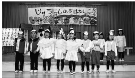
年長・十二支のおはなし