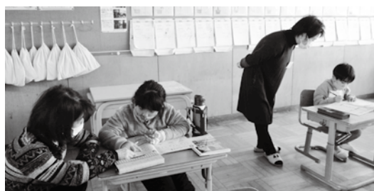
サポーターに教わりながら取り組む様子

区の児童は「銀のスケート」を鑑賞しました。ご協力をいただきました。関係者の皆様に心より感謝申し上げます。