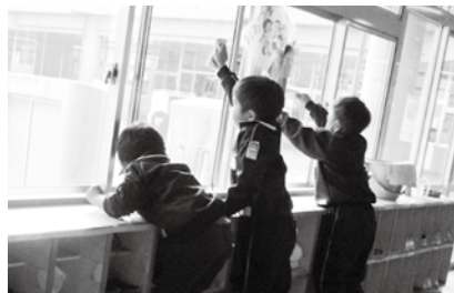
「幼稚園のガラス、ピカピカに磨くぞ!」