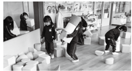
「みんなで大掃除!」 大型積み木を片づける子ども達