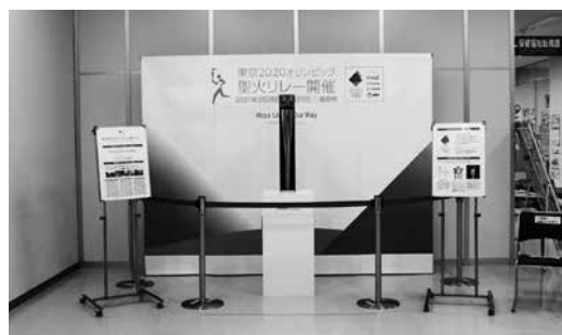
写真：郡山市での展示の様子

※新型コロナウイルス感染症の拡大等によっては、展示期間の見直しや展示を中止する場合があります。