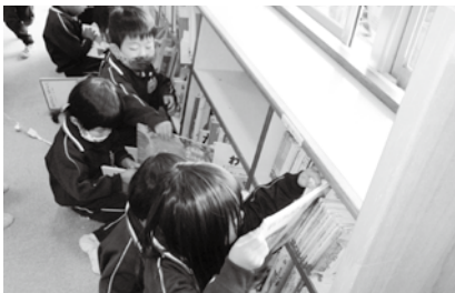
丁寧に絵本の整理をする子ども達

どの学年の園児も活動に取り組む中で「自分はこれをやるんだ!」と責任や自信を持って行動することができました。また、「どうしたら綺麗になるだろうか!」と考えて行動する姿が見られ、大きな成長を感じました。2021年も素晴らし