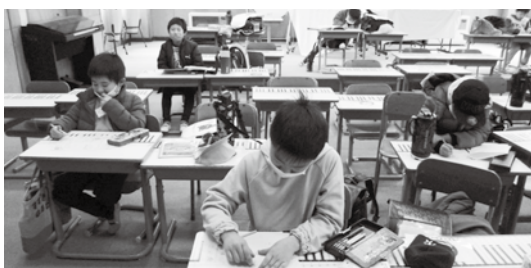
集中して取り組むことができました

第7回放課後子ども教室「冬期学習会」が、12月21日(月)に第二小学校で、12月25日(金)に第一小学校でそれぞれ開催され、一小地区31名、二小地区20名の児童が参加しました。年内最後となった今回子ども教室は、冬休み期間中の課題学習に取り組むことを想定しておりましたが、新型コロナウイルス感染症の予防対策により密を避けるため、日程調整との兼ね合いで二小地区は冬休み前の開催となりました。二小地区の児童はいつもの課題学習に、一小地区の児童は冬休みの課題学習にそれぞれ集中して取り組むことができました。また、年内最後の子ども教室ということもあり、特別にDVD鑑賞会の時間も設け、一小地区の児童は「ウィンターワンダーランド」を二小地