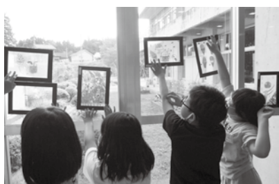
光に透かして楽しむ二小児童