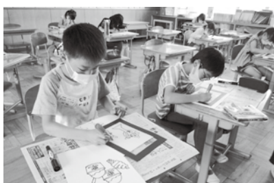
集中して絵を描く一小児童

イントをしつかりと押さえ、とても綺麗なステンドグラスのような絵を仕上げ、太陽の光を透かして見たり、影を楽しんだり、できあがった絵を様々な視点で楽しんでいました。 これからの教室でもたくさんの人と触れ合い、多くの経験を積んでほしいと思います。