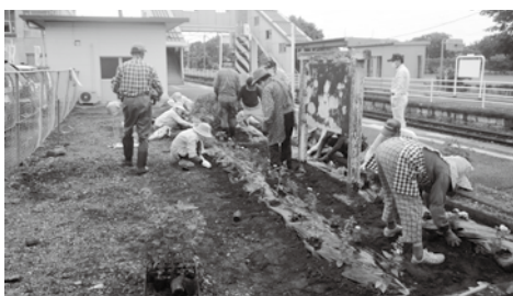
駅構内に色とりどりの花を植栽しました

作戦に参加された皆さん、大変お疲れ様でした。泉崎駅にお立ち寄りの際は、色とりどりに植栽されました花壇をぜひご覧ください。