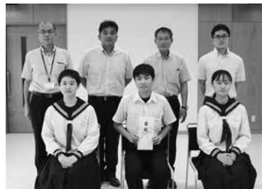
交付式に臨む生徒たち

一つの目標に向かってひたむきに努力される中学生の皆さんを誇らしく感じました。これからの皆さんの人生に必ず活かされることと思います。