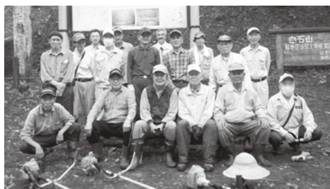
いちょうの会の皆さん