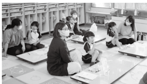
歯磨き指導の様子

そのほか、お菓子やジュースに含まれる砂糖の量や歯ブラシの選び方などの説明もあり、参加した親子は、歯磨きの大切さをわかりやすく、楽しく学ぶことができたようでした。